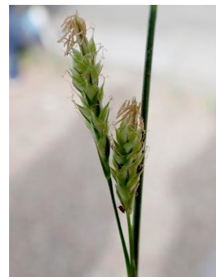
ナキリスゲ 241027