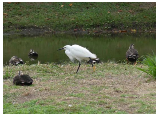
コサギ 心字池 241027