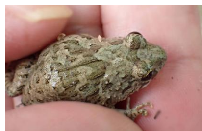
ヌマガエル 241027