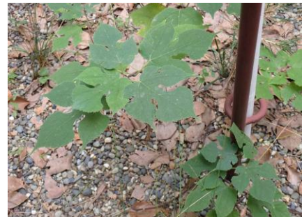
カジノキ 241027