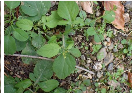
ミチバタガラシ 241027