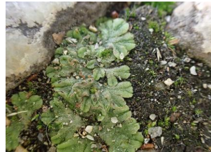
コハタケゴケ 241027