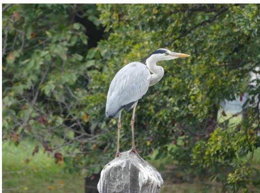
アオサギ 心字池 241027