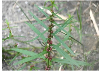
ホソバヒメミソハギ 241027

タンポポ属の一種 1 チョウジタデ 3 ノゲシ 1 ホソバヒメミソハギ 3 ホナガイヌビユ 2,3 ムラサキカタバミ 1 メヒシバ 3