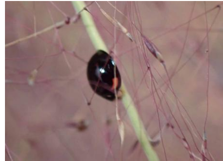
ダンダラテントウ 241027 撮影 榎元慶子

コミカンソウ 3 コメシバ 2,3 スベリヒユ 2,3 セイトカアワダチソウ 1 センダン 4 ダイダイゴケ科の一種 1 ツボミオオバコ 1 ツユクサ 2,3 トウバナ 2 ニワホコリ 3 ネズミノオ 3 ノゲシ 1 ハマスゲ 3 ヒナタイノコヅチ 3 ヒメジョオン 1 ヒメムカシヨモギ 3 ヒルガオ属の一種 1 ヘクソカズラ 1 ホトケノザ 1 ホナガイヌビユ 2 マルバツユクサ 1 ムクロジ● 3 ムラサキカタバミ 1 メシバ 3 メリケンガヤツリ 2 メリケントキンソウ 1 ヤハズエンドウ 1 ヤブガラシ 1 ヨモギ 1 外来タンポポの一種 2,3