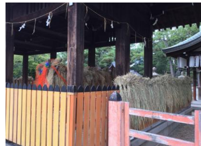
御田のイネが干されていた 241027

コニシキソウ 2 コムカンソウ 3 コメヒシバ 2 ツユクサ 2,3 ムラサキカタバミ 1 外来タンポポの一種 2