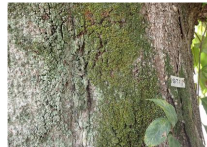
ヒナノハイゴケ 241027