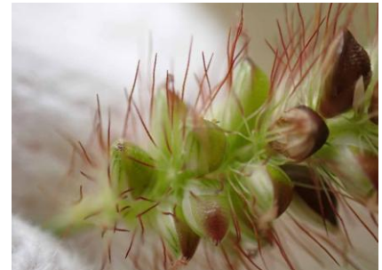
キンエノコ 241027