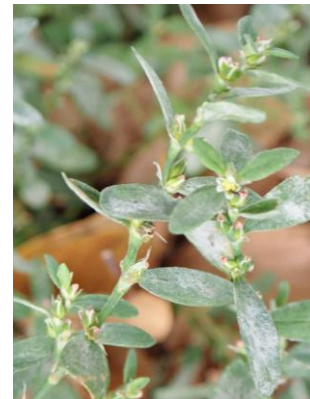
ミチヤナギ 241027

カタバミ 2 キンモクセイ●2 クサイ 3 コメシバ 3 シマスズメノヒエ 2,3 シロツメクサ 2 スベリヒユ 1 セイトカアワダチソウ 2 センダン 4 タチスズメノヒエ 1 タマザキフタバムグラ 2,3 ツククサ 2,3 ネズミノオ 3 ハナカタバミ●2 ハマスゲ 3 ヒルガオ属の一種 1 ホトケノザ 1 ホナガイヌビユ 2,3 マメゲンバイナズナ 2,3 ミチヤナギ 2 ムラサキカタバミ 1 メシバ 2,3 メリケントキンソウ 1 ヤブガラシ 1 ヨモギ 1 外来タンポポの一種 2