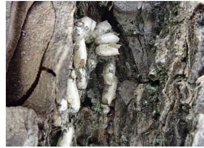
寄生バチの一種の繭殻 (マイマイガに) 241027 撮影 中西花奈

チチコグサモドキ 1 ツボミオオバコ 1 ツメクサ属の一種 2,3 ナミガタウメノキゴケ 1 ニワホコリ 3 ノキシノブ 1 ノゲシ 2 ハイゴケ 1 ハナカタバミ●2 ヒナノハイゴケ 1,2 ヒメアカヤステゴケ 1 ヒメジョオン 2,3 ヒメムカシヨモギ 1 ヘクソカズラ 1 ヘリトリゴケ 1 ホトケノザ 1 ホナガイヌビユ 2,3 マメゲンバイナズナ 3 ムカデコゴケ 1 メヒシバ 2,3 メリケントキンソウ 1 モエギトリハダゴケ 1 ヤブガラシ 1 レブラゴケ属の一種 1 ロウソクゴケ 1