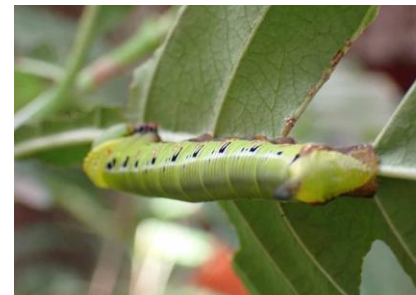
オオスカシバ 241027