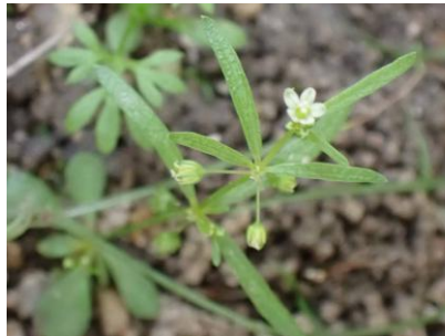
クルマバザクロソウ 241027