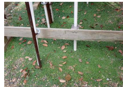
アオイゴケ 241027

・クロガケジグモ 0 巣 ・クロヤマアリ 4 ・サトユミアシゴミムシダマシ 4 ・シロアヤヒメノメイガ 4 ・ツヅレサセコオロギ 4 ・トビイロシワアリ 4 ・ナカグロクチバ 2,4 ・ハシブトガラス 4