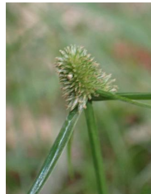
アイダクグ 241027