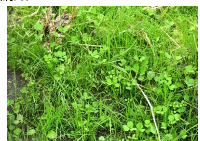
御田内の様子 241027