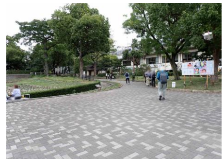
住吉公園 241027