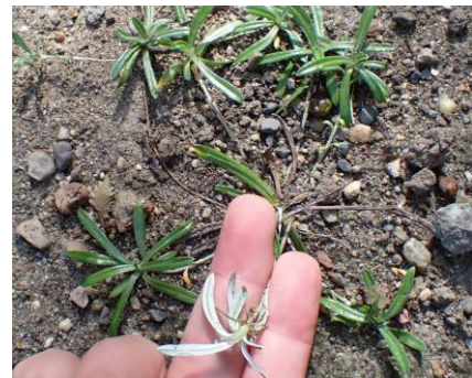
チチコグサ 241027