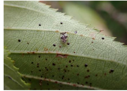
ナシグンバイ 241027