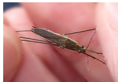
アメンボ 241027

クログアネモチ ● 3 ツユクサ 3 ヒメジョオン 1 ヘクソカズラ 1 ムラサキカタバミ 1 メヒシバ 3 ヤブガラシ 1