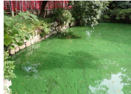
石舞台の池：絵の具のような鮮やかな 緑色はアオコ（ラン藻）の発生か 241027