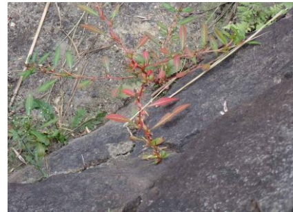
チョウジタデ 241027