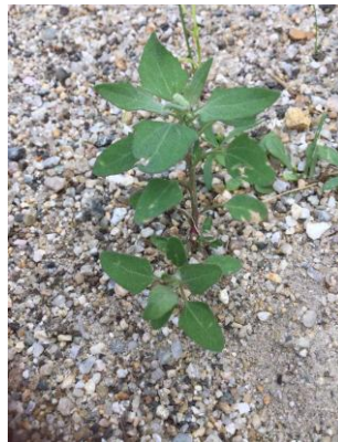
シロザ 241027