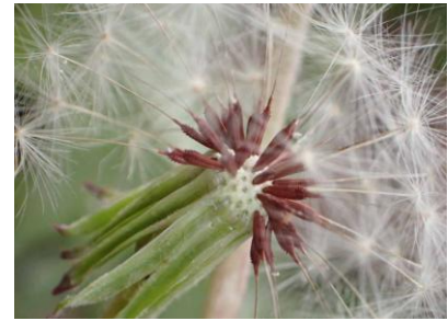
アカミタンポポ 241027

ナンキンハゼ 4 ノゲシ 1 ノビル 1 ヒガンバナ 1 ヒメジョオン 2,3 ホソバナチチコグサモドキ 3 ホトケノザ 3 マメグンバイナズナ 3 マルバツユクサ 2 メヒシバ 3 メリケントキンソウ 1 ヤハズエンドウ 1 ヤブガラシ 1 ヨウシュヤマゴボウ 1 ワルナスビ 1 外来タンポポの一種 2