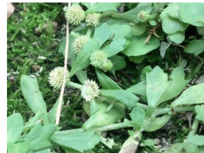
トキンソウ 241027