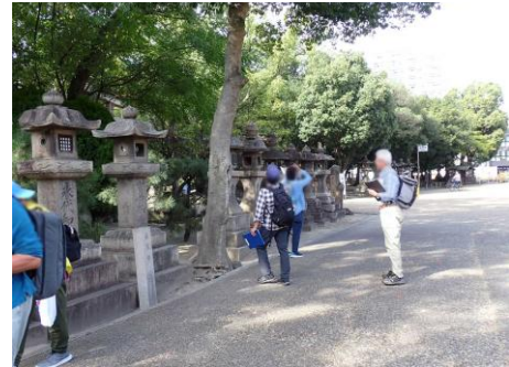
調査の様子：住吉大社 241027

キュウリグサ 1 クルマバザクロソウ 2,3 コニシキソウ 2,3 コミカンソウ 3 タンポポ属の一種 1 チチコグサ 1 ツククサ 2,3 トキンソウ 2,3 ノキシノブ 1 ヒメムカシヨモギ 2,3 ヘクソカズラ 1 ホトケノザ 1 マメゲンバイナズナ 3 ミチバタガラシ 2,3 ムラサキカタバミ 1 メヒシバ 2 メリケントキンソウ 1