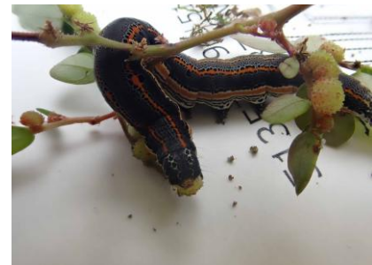
ナカグロクチバ 241027

サヤゴケ 2,3 ジンガサゴケ 1 スズメノカタビラ 3 スベリヒユ 2,3 スマレ属の一種 1 タネツケバナ 3 チチコグサモドキ 2 チドメグサ 1 ツメクサ属の一種 2,3 ツヤゴケ属の一種 1 ツユクサ 2 トキンソウ 2 トリハダゴケ科の一種 1 ニワホコリ 3 ネジクチゴケ 1 ノキシノブ 1 ノゲシ 1 ヒナノハイゴケ 1 ヒメアカヤステゴケ 1 ヒメムカシヨモギ 3 ヒメレンゲゴケ 1 ヘクソカズラ 1 ホソバオキナゴケ 1 ホトケノザ 1 ムラサキカタバミ 1 メシバ 3 メリケントキンソウ 1 ヤブジラミ 1 レブラゴケ属の一種 1 ロウソクゴケ 1 外来タンポポの一種 1