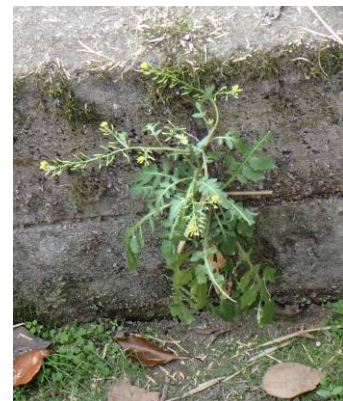
スカシタゴボウ 241027