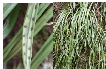
ノキシノブ 241027