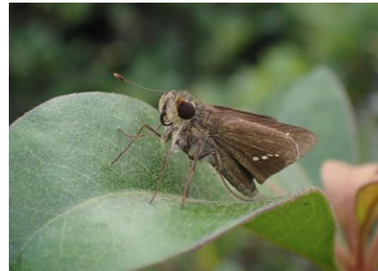
イチモンジセセリ 241027