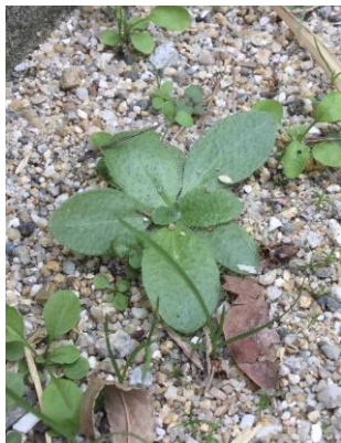
ツボミオオバコ 241027