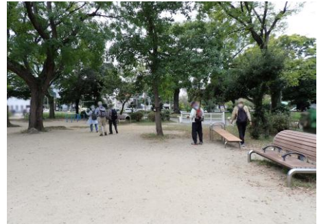
住吉公園 241027