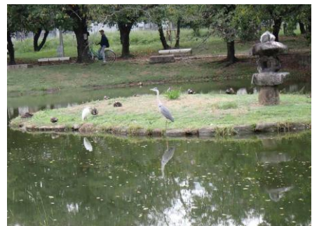
心字池の島にアオサギ、コサギ、カルガモが集まっていた 241027