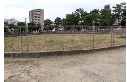
御田：稲刈り後の姿 241027