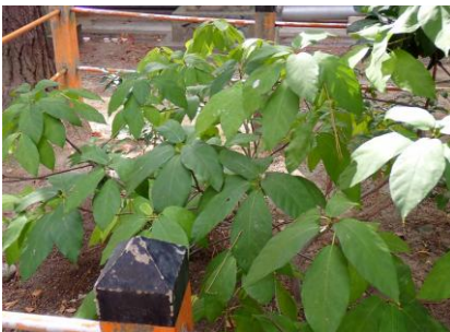
イヌビワ 241027