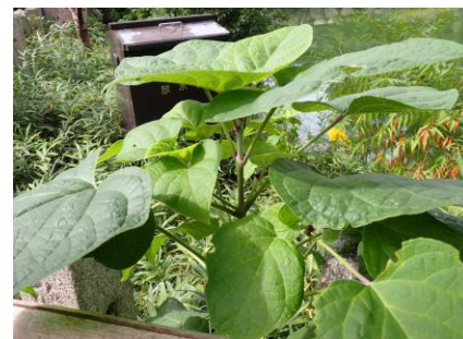
クサギ 241027