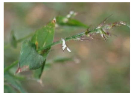
ケチチミザサ 241027