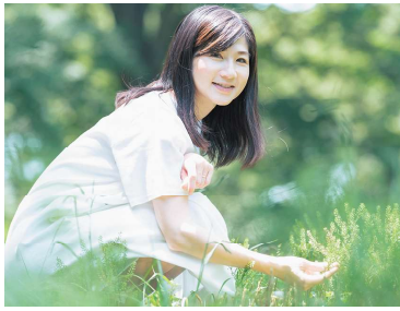
井田 寛子 (いだひろこ)

筑波大学卒業後、製薬会社を経て2002年からNHKキャスターとして活動。2006年に気象予報士登録。現在はWWFジャパン顧問、NPO法人気象キャスターネットワーク理事長として、気候変動問題に関する講演や委員活動等で活躍。