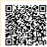
お申込みフォーム