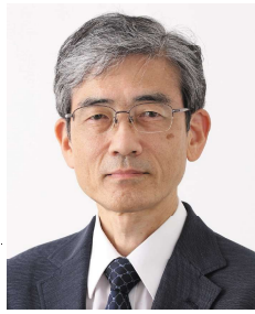
村田 路人 (むらたみちひと)

筑波大学卒業後、製薬会社を経て2002年からNHKキャスターとして活動。2006年に気象予報士登録。現在はWWFジャパン顧問、NPO法人気象キャスターネットワーク理事長として、気候変動問題に関する講演や委員活動等で活躍。