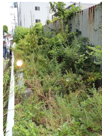
福永小の一橋通に面した 駐車場外側の実生群 240825