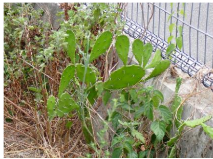
ウチワサボテン属 植栽が逃げたか 240825