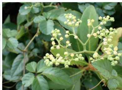
ヤブガラシ 240825