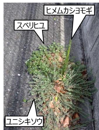
アスファルトとコンクリートブロックの わずかな隙間に3種 240825