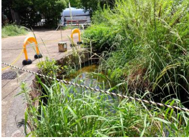
せせらぎの里内に残っている水路 240825