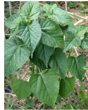
クワクサ 240825 撮影 柗元慶子