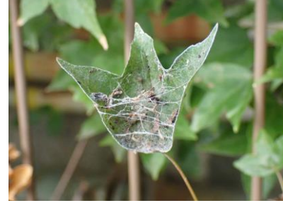
ネコハグモの巣 240825