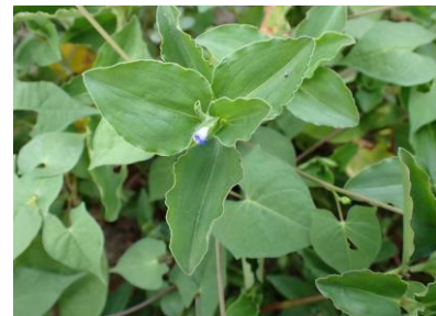
マルバツクサ 240825