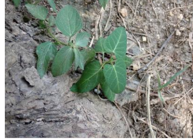
ガガイモ 240825