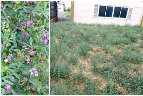
水道局異配水場南東敷地内 ムラサキウマゴヤシばかりが繁茂 240825