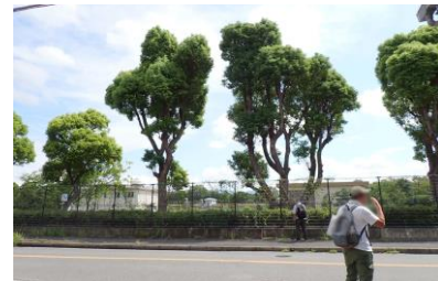
水道局巽配水場西側 クスノキの枝が強く剪定された 240825