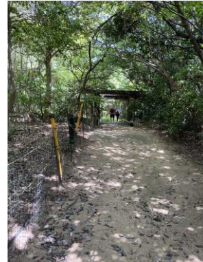
せせらぎの里入口より 240825

コニシキソウ 2,3 ツメクサ属の一種 2 ヒメジョオン 1 ヘクソカズラ 1 ヤブガラシ 1 ヨモギ 1