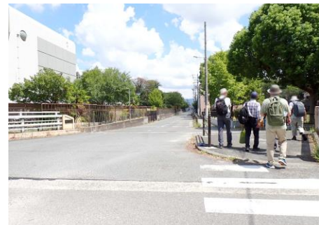
左：平野下水処理場 右：加美末次公園 240825