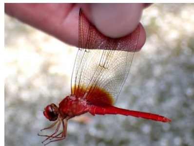
ショウジョウトンボ 240825