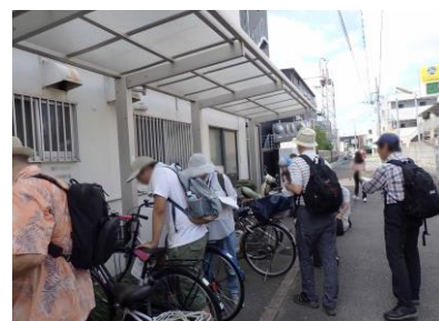
南巽駅東街路 240825 撮影 柘元慶子