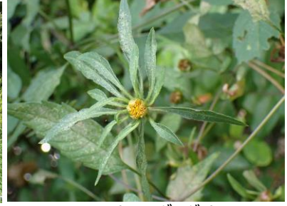
アメリカセンダングサ 240825