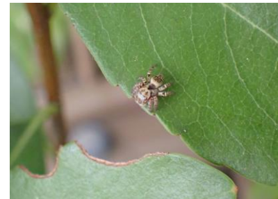
ハエトリグモ科の一種 240825