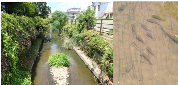
加美巽川（加美末次橋より）には魚影 240825