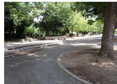
巽東緑地の南側は高木が多い 240825