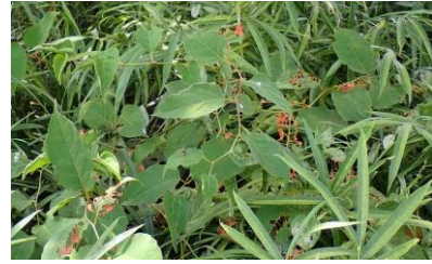
イタドリ 240825