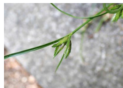
クグガヤツリ 240825