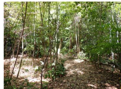
せせらぎの里の奥は立ち入れない 240825 撮影 柘元慶子

オオアレチノギク 3 オッタチカタバミ 1 キカラスウリ 1 コセンダングサ 2 コニシキソウ 2,3 コムラサキ ● 3 セイトカアワダチソウ 1 センダン 4 タチスズメヒエ 2,3 トウバナ 1 ハゼラン 2,3 ヒナタイノコヅチ 1 ヒメジョオン 2 ヒメムカシヨモギ 2 ミツバアケビ 3 ヤブガラシ 1 ヤマノイモ 1 ヨモギ 1