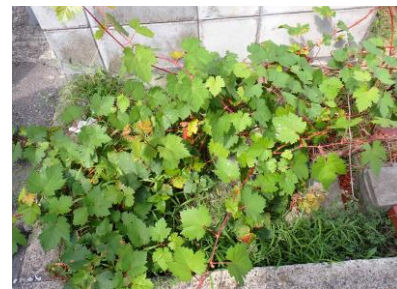
ブドウ 240825