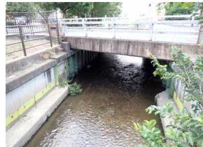
加美末次橋 240825