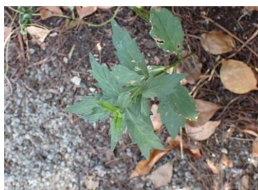
ヨメナ 240825