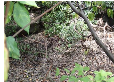
かつての水面だったところが枯れて イヌビワの枝が落ちていた 240825