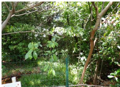
池に近いところのイヌビワ大木は 健在だった 240825