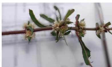
ホソバツルノゲイトウ 240825