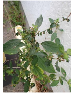
エノキグサ 240825

クスノキ 4 クワクサ 2,3 クンショウギク ●2 コニシキソウ 2,3 コヒルガオ 2 サフランモドキ ●2 シチヘンゲ 2,3 シャリンバイ ●3 スベリヒユ 2 セイタカアワダチソウ 1 センダン 4 チガヤ 1 ツユクサ 2 ナガイモ 1 ナガエコミカンソウ 2,3 ナンキンハゼ 4 ノゲシ 2,3 ハマスゲ 2,3 ヒメジョオン 2,3 ヒメムカシヨモギ 2 ヒルガオ 2 ブーゲンビリア ●2 ヘクソカズラ 2 ホソバツルノゲイトウ 2,3 マルバアメリカアサガオ 2 マルバツユクサ 2 マルバルコウ 2 ムクゲ ●2 ムラサキウマゴヤシ ◎2,3 メヒシバ 2 ヤドリフカノキ ●1 ヤブガラシ 2 ヨモギ 1