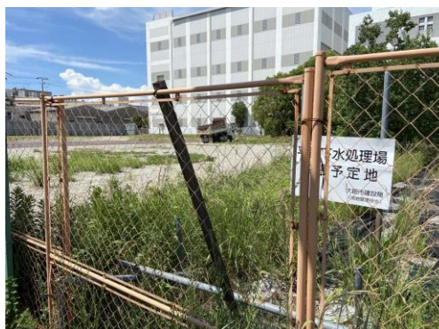
建設局空き地（ケリの繁殖地） 下水処理場拡張予定地でダンブカーが入り 工事がされている 240825

センダン 4 タチスズメノヒエ 2 チガヤ 1 ナンキンハゼ 4 ハマクマツヅラ 2,3 ヒメムカシヨモギ 2 ヒロハホウキギク 1 ヘクソカズラ 2 メリケンガヤツリ 3 ヨウシュヤマゴボウ 3 ヨモギ 1