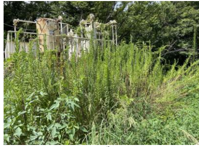
セイタカアワダチソウ群落 240825