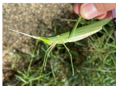
ショウリョウバッタ 240825