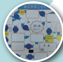
地球環境市民会議（CASA）