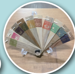
にしもく&イー・ピーング