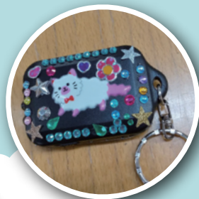
リアルにブルーアースおおさか