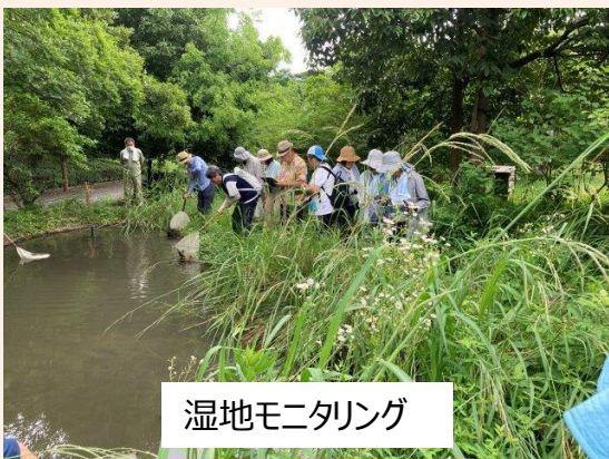
湿地モニタリング