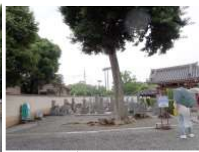
過去にスダジイの大きな生垣があつた場所 240623 撮影 柗元慶子