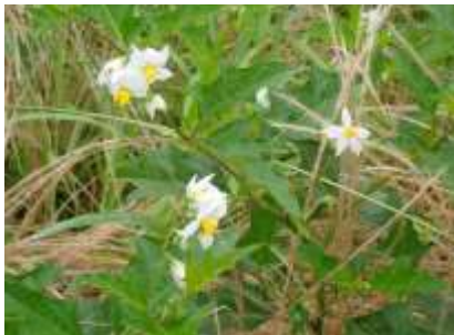
ワルナスビ 240623