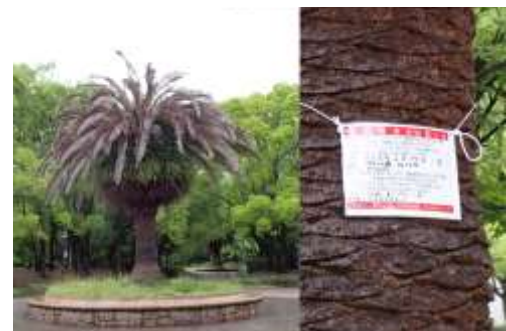
郷土の森中央のフェニックス（カナリーヤシ）の葉が枯れていて、薬剤散布の札がかかっていた 240623

・トビズムカデ 4 ・ナミコギセル 4 ・ナミテントウ 4 ・ニジウヤホシテントウ 4 ・ニホンカナヘビ 2 ・ハシブトガラス 2,4 ・ハシボソガラス 4 ・ハラビロカマキリ 2 ・ヒトスジシマカ 4 ・ヒメカメノコテントウ 4 ・ヒヨドリ 0 声 ・ヒロヘリアオイラガ 0 羽化後繭 ・ベニシジミ 4 ・ヘリグロテントウノミハムシ 4 ・ホソヒメヒラタアブ 4 ・マダラスズ 0 声 ・ムーアシロホシテントウ 4 ・ムラサキシジミ 4 ・モモトチビハナアブ 4 ・モリチャバネゴキブリ 4 ・モンシロチョウ 4 ・ヤガの一種 4 アオイゴケ 1 アキコレ 4