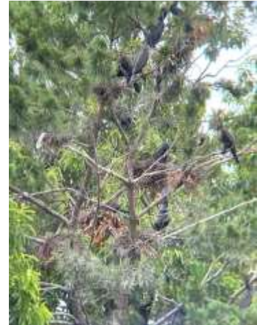
カワウのコロニー 240623

イヌガラシ 2,3 イヌタデ 1 イヌタデ属の一種 1 エノキグサ 1 オオニワゼキショウ 2,3 オオバコ 2 オッタチカタバミ 1 カタバミ 2 カラクサナズナ 2 キカラスウリ 1 キシュウスズメノヒエ 2 ギンゴケ 1 クサイ 3 クチナシ●2 ケキツネノボタン 2,3 コニシキソウ 2 コメツブウマゴヤシ 2 シマスズメノヒエ 2,3 シュロガヤツリ●2,3 ショウブ●3 シロツメクサ 2 スイレン●2 スギナ 1 スズメノカタビラ 2 セイタカアワダチソウ 1 セリ 1 タチスズメノヒエ 2 ダンドボロギク 1 チチコグサモドキ 2 ツメクサ属の一種 2,3 ツユクサ 1 トキワハゼ 2 ナズナ 3 ノチドメ 1 ハス●2 ハングショウ●2 ヒメイワダレソウ●2 ヒメガマ●3 ヒメコバンソウ 2