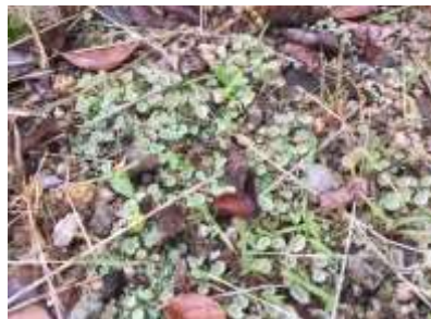
ヒメジョウゴゴケモドキ 子器多数 240623