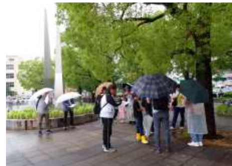
長居公園入口 雨の中の調査 240623