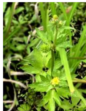
ケキツネノボタン 240623