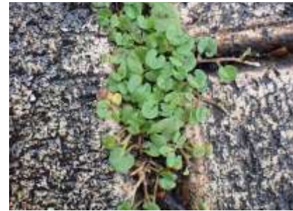
アオイゴケ：競技場付近 240623