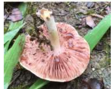
ハラタケ属の一種 240623 撮影 中西有美