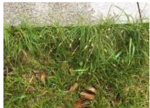
クオカワズスゲ：あまりみられない種 群生していた 240623