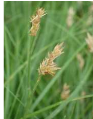
クオカワズスゲ 穂の拡大写真 240623