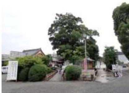
臨南寺境内 240623