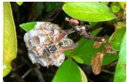
フタモンアシナガバチ 240623 撮影 中西花奈

ハナツクバネウツギ ●2 ヒナタイノコヅチ 1 ヒナノハイゴケ 2 ヒメイワダレソウ ●2,3 ヒメジョオン 2,3 ヒメヒトヨタケ属の一種 1 ヒメムカシヨモギ 1 ヘクソカズラ 1 ヘラオオバコ 2 ホソバナチチコグサモドキ 2 ホソムギ 2 マツバゼリ 2,3 マメグンバイナズナ 2,3 ムカデゴケ 1 ムラサキカタバミ 2 ヤハズエンドウ 3 ヤブガラシ 1 ヤブヘビイチゴ 3 ヨウゲショウ 1 レブラゴケ属の一種 1 ロウソクゴケ 1 外来タンポポの一種 2