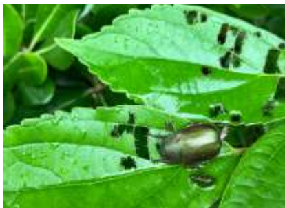
アオドウガネ 240623 撮影 中西花奈