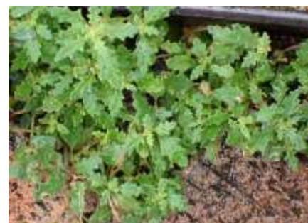
ゴウシュウアリタソウ 240623