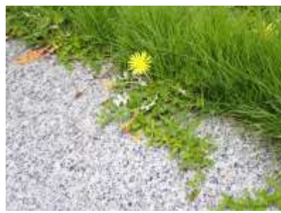
ワタゲツルハナグルマ：植栽逸出か 240623