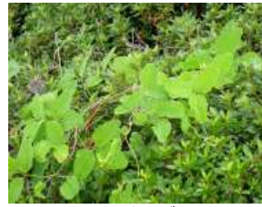
ミツバアケビ 240623