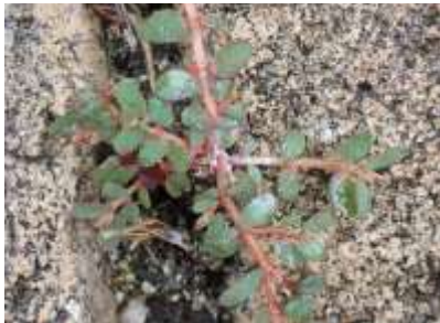
コシキソウ 240623 撮影 柗元慶子