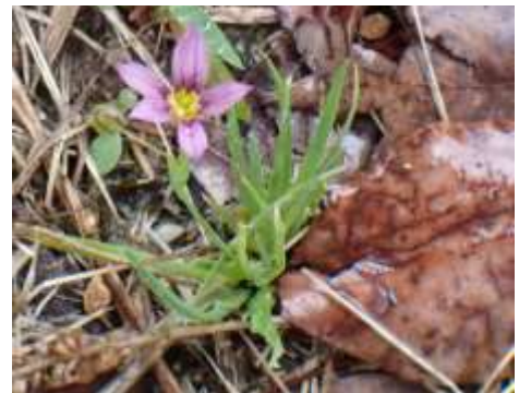
ニワゼキショウ この花は5弁(通常6弁) 240623