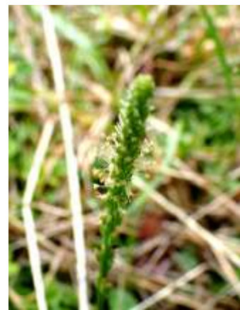
オオバコ 240623

アオイゴケ 1 アキコレ 1 アメリカスズメノヒエ 2 アレチヌスビトハギ 1 イヌムギ 3 ウラジロチチコグサ 1 エノキ 4 エノキグサ 1 オオバコ 2 オッタチカタバミ 1 オニタビラコ 2,3 カモジグサ 2,3 キュウリグサ 2 クグガヤツリ 2,3 クサイ 3 クロウラムカデゴケ 1 コナスビ 2 コニシキソウ 2,3 コブシ ●3 コマツヨイグサ 1 シマスズメノヒエ 2 シラカシ ●3 シロツメクサ 2,3