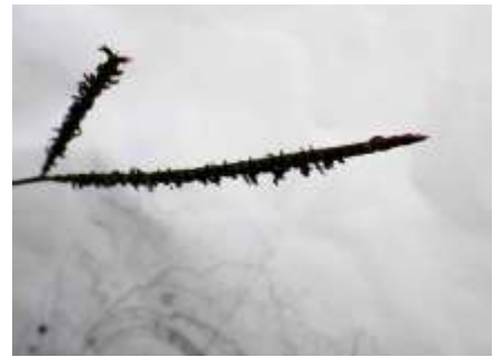
アメリカスズメノヒエ 240623

ヒナキキョウソウ 3 ヒメジョウゴゴケモドキ 1 ヒメジョオン 1 ヒメムカシヨモギ 1 ホソムギ 2 マメグンバイナズナ 2,3 ムカデコゴケ 1 ムラサキカタバミ 2 メシバ 1 ヤブガラシ 1 レブラゴケ属の一種 1