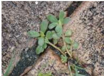
スベリヒユ 240623