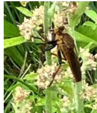
アオメアブがセマダラコガネを捕食中 240623