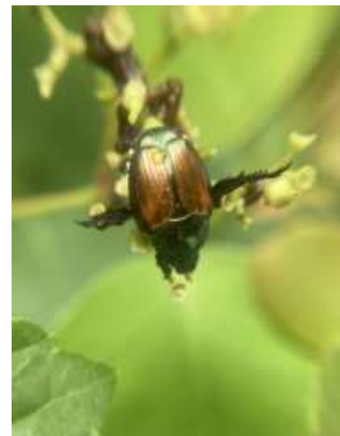
マメコガネ 240623 撮影 林耕太

アゼナルコ 3 アメリカセンダングサ 1 アレチギシギシ 1 ウラジロチチコグサ 2,3 エノキグサ 3 エノコログサ 2 オオバコ 2 オッタチカタバミ 1 カモジグサ 3 キュウリグサ 2 コナアカハラムカデゴケ 1 コニシキソウ 2 コフキチリナリア 1 シロツメクサ 2,3 セイトカアワダチソウ 1 セイトカヨシ 1 センダン 4 ダイダイゴケ科の一種 1 ナギナタガヤ 3 ニワゼキショウ 2 ネズミモチ ● 2 ヒナキキョウソウ 3 ヒナノハイゴケ 1 マメガンバイナズナ 2,3 ムカデコゴケ 1 ムシクサ 2 ムラサキカタバミ 2 ヤブガラシ 2 レプラゴケ属の一種 1