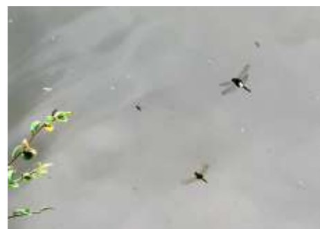
コシアキトンボ 240623