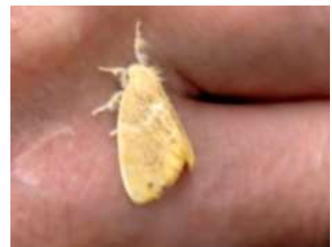
チャドクガ：手にとまってしまい、そっと逃がしたので、後でやや痛痒い程度で済んだ（中谷憲一） 240623