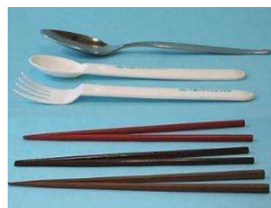
塗り箸、スプーン、フォーク