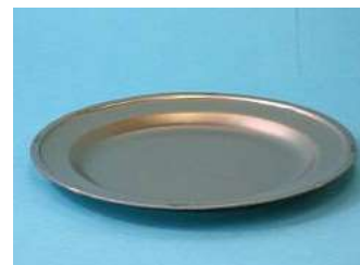
アルマイト製 18cm 平皿