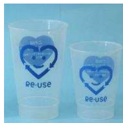
PP製 450ml 中カップ PP製 280ml 小カップ