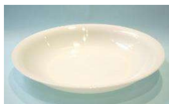
PP製 22×3.3 cm L皿