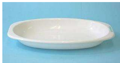
PP製 25×17.5cm カレー皿