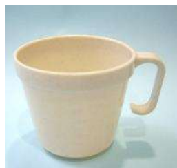
PP製240ml コーヒーカップ