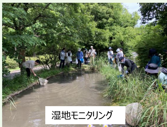
湿地モニタリング