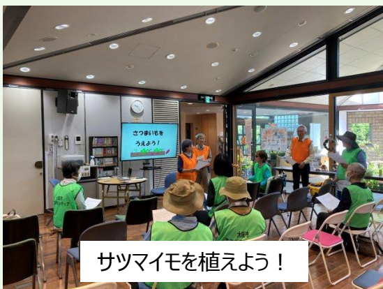
サツマイモを植えよう！