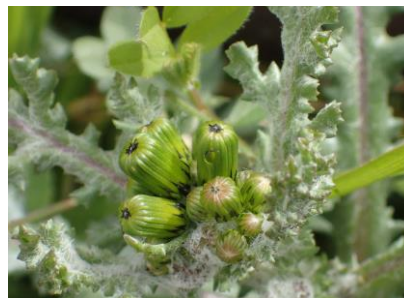
ノボロギク 230226