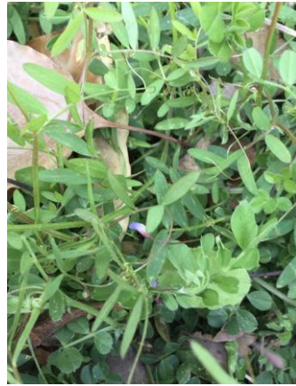
カスマグサ 230226