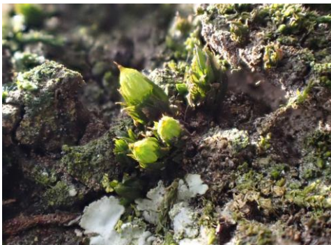
タチヒダゴケ 230226