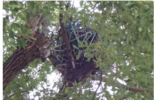
カラスの巣：ワイヤーハンガーが見える 230226