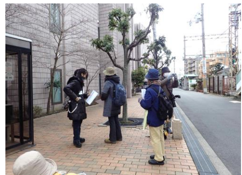
帝塚山駅周辺 230226 撮影 柊元慶子

・オカダンゴムシ 4 チチコグサモドキ 1 ・クロガケジグモ 0 巣 ツメクサ sp.1 ・メジロ 4 ノゲシ 1 アメリカアゼナ 1 ノボロギク 2 イノモトソウ属の一種 1 ハリガネゴケ科の一種 1 ウラジロチチコグサ 1 ヒメツルソバ 1 オニタビラコ 2 ホソバノチチコグサモドキ 2 オランダミナグサ 1 ホトケノザ 1 カタバミ 1 マツバウンラン 1 カタバミ sp.1 ムラサキカタバミ 1 ギンゴケ 1 ヤハズエンドウ 1 スズメノカタビラ 2 ヤブジラミ 1 セイトカアワダチソウ 1 ヤブソテツ属の一種 1 ダイダイゴケ科の一種 1