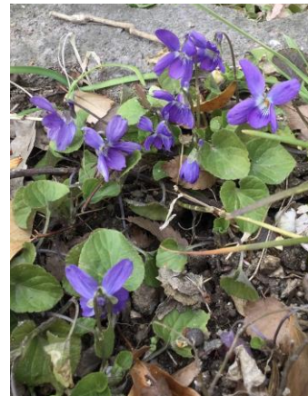
スミレ属の一種 アメリカスミレサイシン？ 230226