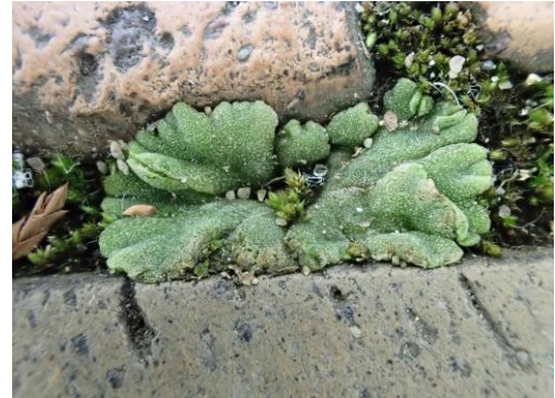
ハタケゴケ属の一種 230226

コバナツツナミ 3 タマサゴ●3 ツメクサ sp.1 ナガミヒナゲシ 1 ホトケノザ 2 ムラサキカタバミ 1