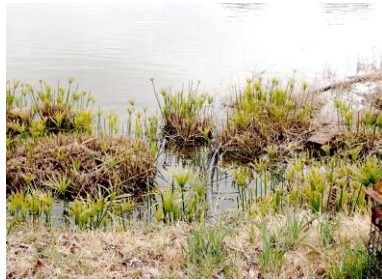
シロガヤツリ 230226