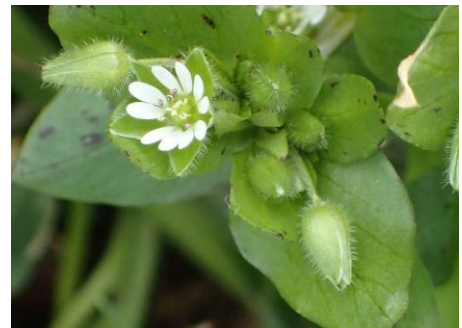
ミドリハコベ : おしべ8本、めしべの花柱は3つ 230226