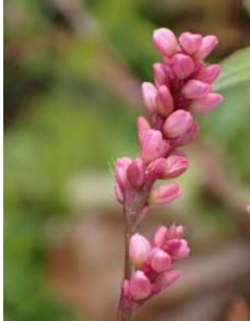
イヌタデ 230226