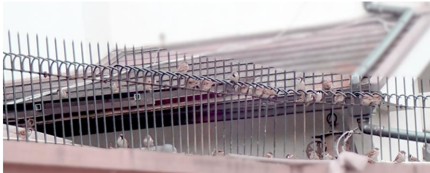
スズメの大群：万代池周辺の住宅 230226