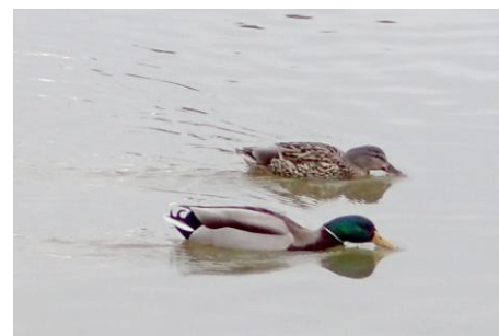
マガモのペア 230226