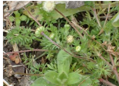
マメカミツレ 230226