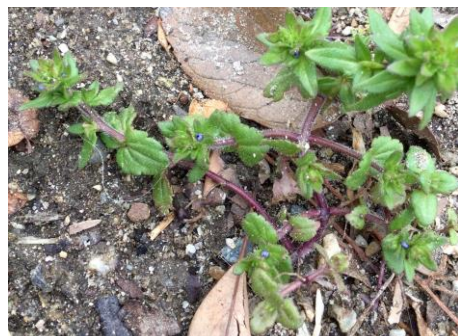
タチイヌノフグリ 230226