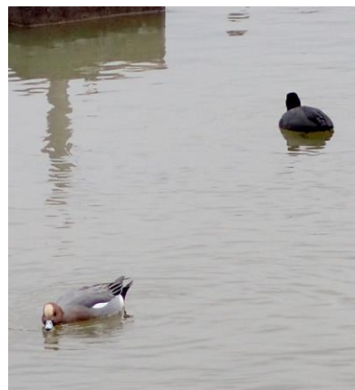
ヒドリガモ (左) とオオバン (右) 230226