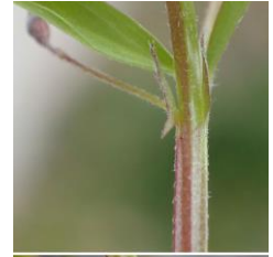
カスマグサの托葉 230226