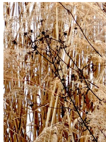
枯れたヨシの群落の中に アメリカセンダングサの枯れた姿があった 230226