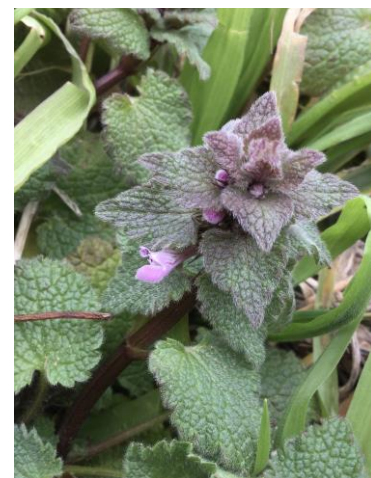
ヒメオドリコソウ 230226

アメリカフウロ 1 イグサ科の一種 1 イヌガラシ 1 イヌタデ 3 イヌムギ 2,3 ウメノキゴケ 1 ウラジロチチコグサ 1 オオアレチノギク 2,3 オオイヌノフグリ 1 オオキバナカタバミ 2 オオバコ 1 オニタビラコ 2,3 オランダハッカ 1