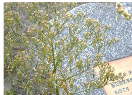
オオアレチノギク 230226