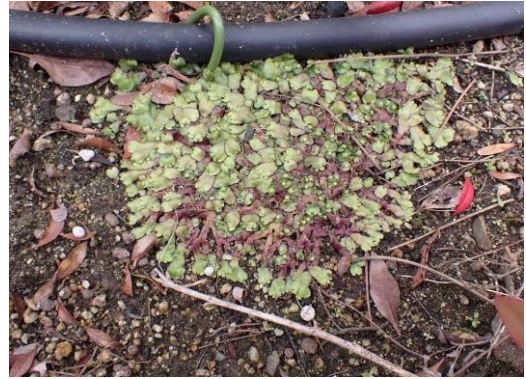
ジンガサゴケ 230226

ノビル 1 ノボロギク 1 ヒラギナンテン●2 ホトケノザ 2 ミドリハコベ 1 ムラサキカタバミ 1 ヤエムグラ 1