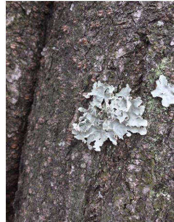
ナミガタウメノキゴケ 230226 撮影 中西有美

・オオバン 4 ・マガモ 4 ・ヒドリガモ 4 ・ホシハジロ 4 ・メジロ 4 ・カワセミ 4 ・チョウゲンボウ 4 シュロガヤツリ●2 ヨシ 1 アメリカセンダングサ 3 イグサ科の一種 1 スイセン●2