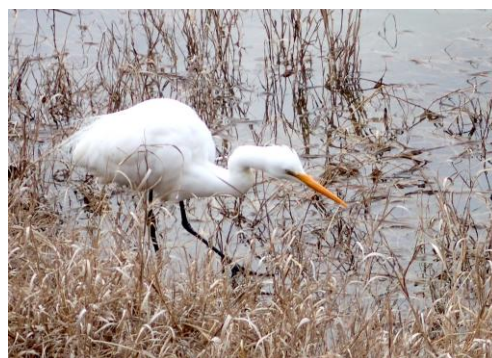
ダイサギ：慎重にゆっくりと餌を探していた 230226