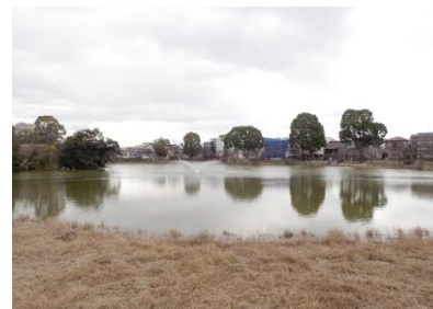
万代池：水際のヨシの多くは刈られていた 230226