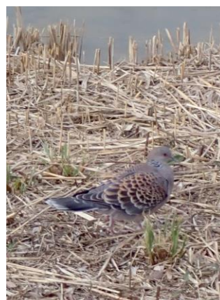
キジバト 230226