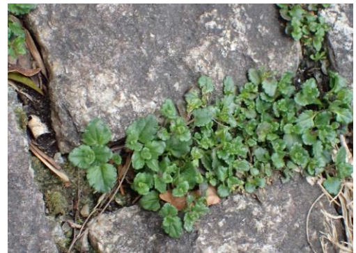
オオイヌノフグリ 230226