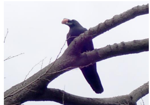
ハシブトガラス：食事？ 住宅のベランダに、 くわえた実を隠すような様子も見られた 230226 撮影 中西花奈

セイタカアワダチソウ 1 ダイダイゴケ科の一種 1 タマサング●1 チガヤ 1 チチコグサモドキ 1 トケイソウ●1 ナガミヒナゲシ 1 ノチドメ 1 ノビル 1 ノボロギク 1 ヒナノハイゴケ 2 ヒメアカヤスデゴケ 1 ヒメジョオン 2 ホトケノザ 2 マメグンバイナズナ 2,3 ミドリハコベ 2 メリケントキンソウ 1 ヤエムグラ 1 ヨモギ 1 レブラゴケ sp.1 ロウソクゴケ 1