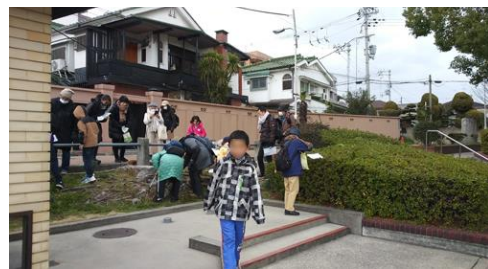
万代池公園の北西入口 230226

オオバコ 1 オニタビラコ 2 オランダミミナグサ 2 カスマグサ 2 キヌゲチチコグサ 1 キュウリグサ 2 コツブキンエノコ 3 コハコベ 1 シュロガヤツリ●1 シロツメクサ 1 スマレ sp.2 セイタカアワダチソウ 1 ゼニアオイ属の一種 1 タチイヌノフグリ 2 チチコグサ 1 チチコグサモドキ 2 ツルニチニチソウ 2 ナガミヒナゲシ 1 ナズナ 2,3 ナミムカデゴケ 1 ナルトサワギク★2