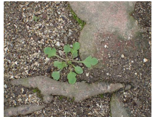
ナガミヒナゲシ 230226

コモチネジレゴケ 1 サヤゴケ 1 シロツメクサ 1 ジンガサゴケ 1,2 スズメノカタビラ 1 セイトカアワダチソウ 1 ゼニゴケ 1 タネツケバナ 2,3 チチコグサモドキ 1 ツメクサ sp.2 ノゲシ 1 ハタケゴケ sp.1 ヒメオドリコソウ 1 マツ sp.1 ミチタネツケバナ 2,3