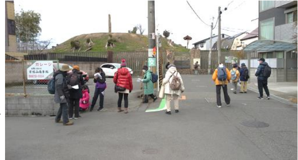
木々の伐採で帝塚山古墳の形があらわになったままの姿 230226