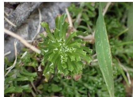
キヌゲチチコグサ 230226