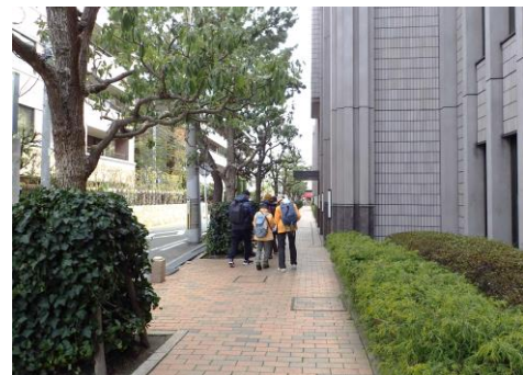
帝塚山学院小学校の北側歩道 230226