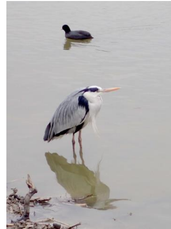
アオサギ 奥はオオバン 230226

ヒラギナンテン●2 ホトケノザ 1 マメグンバイナズナ 2,3 メリケントキンソウ 1 ヤエムグラ 1 ヤハズエンドウ 1 ヨモギ 1