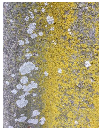
ロウソクゴケ(右)とコフキチリナリア(左) 230226