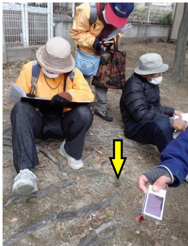
ナルトサワギクが1株だけあった 230226