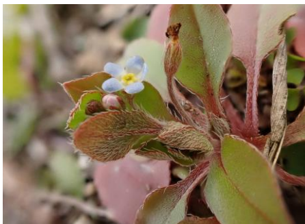
キュウリグサ 230226