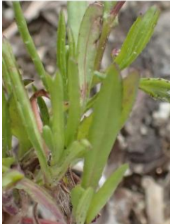
特定外来生物ナルトサワギク 230226