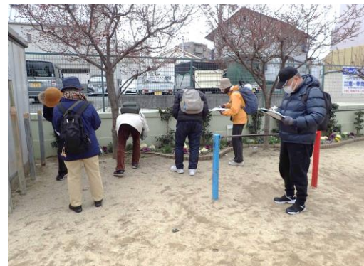
帝塚山小公園の花壇に野草が残っていた 230226

スズメノカタビラ 1 チチコグサモドキ 1 ツメクサ sp.1 ナガミヒナゲシ 1 ノゲシ 1 ヒナノハイゴケ 1,3 ヒメムカシヨモギ 1 ムカデコゴケ 1 レブラゴケ sp.1 ロウソクゴケ 1