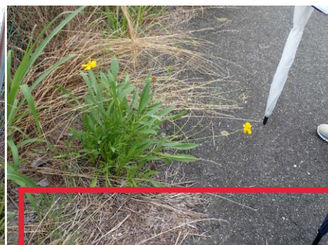
歩道上にもオオキンケイギクの株 確実に生息域を拡大中 210627