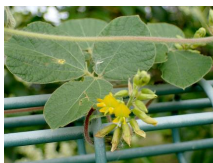
タンキリマメ 210627