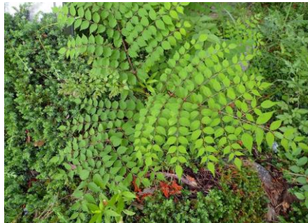
タラノキは大きな掌状羽状複葉で棘がある 210627