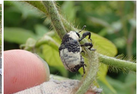
オジロアシナガゾウムシ 210627