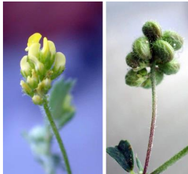
コメツブウマゴヤシ 210627