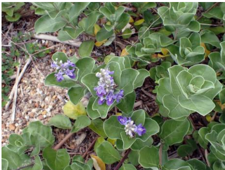
海浜植物のハマゴウが広がっていた 210627