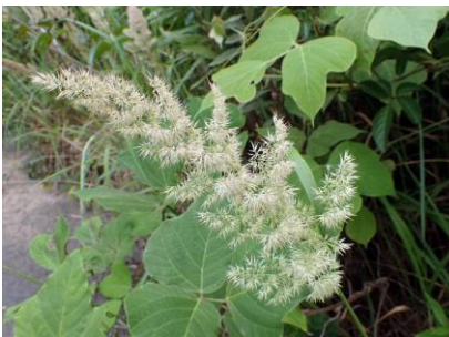
クサヨシ 210627