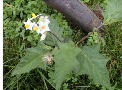
ワルナスビ 棘に注意 210627 撮影 柘元慶子