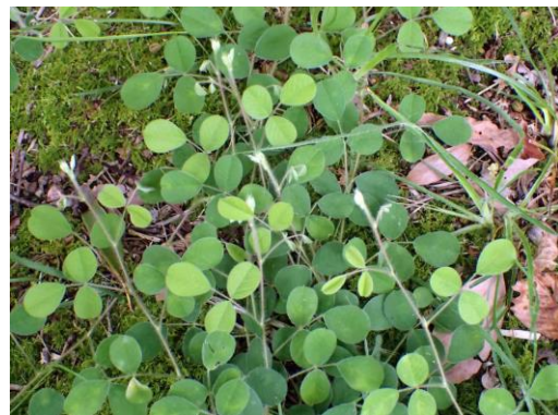
ネコハギ 210627