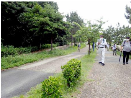
舞洲北側の海沿いの緑道 当初の植栽は密生し深い緑になった(写真左) 210627

マサキ ●2 マテバシイ ●3 メドハギ 1 ヤハズソウ 1 ヤブガラシ 1 ヨモギ 1 外来タンポポの一種 2