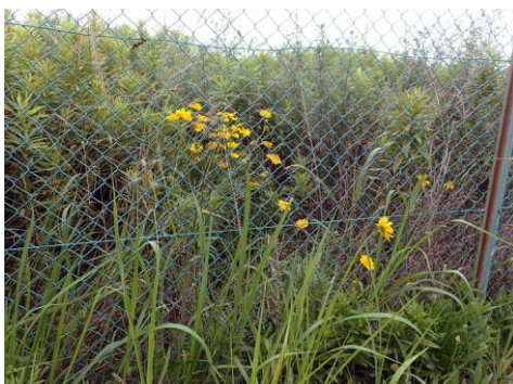
フェンス内にはオオキンケイギクが繁茂 上部を刈るだけでは駆除できない 210627