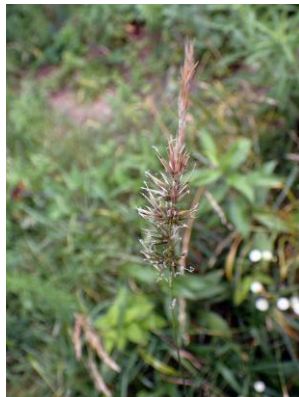
ハルガヤ 210627