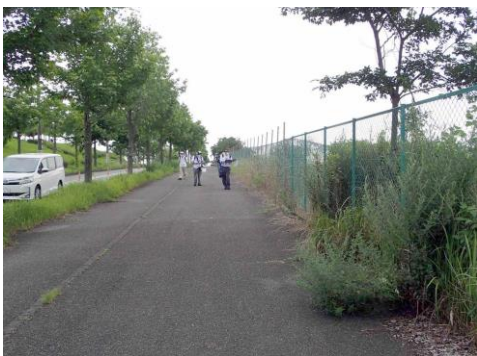
レース場やキャンプ場はフェンスで囲われている 210627

チガヤ 3 テンニンギク●2,3 ナンキンハゼ 4 ニワウルシ 1,4 ヌカススキ 3 ネコハギ 1 ネジバナ 2 ハナヌカススキ 3 ヒメコバンソウ 3 ヒメジョオン 2 ヘラオオバコ 2 マルバツユクサ 1 メドハギ 1 モミジバフウ●1 ヤブガラシ 2 ヨモギ 1