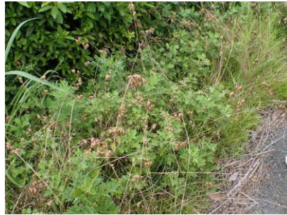
コバンソウ 210627