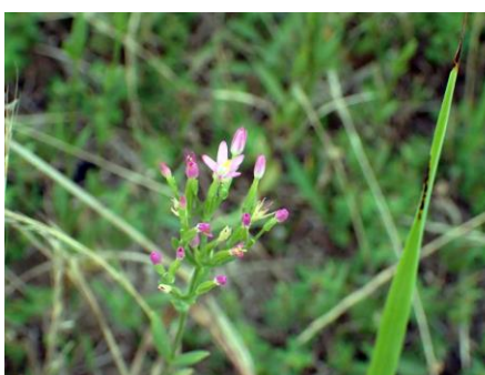
ハナハマセンブリ 210627