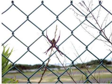
コガネグモ 210627