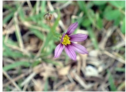
ニワゼキショウ 210627