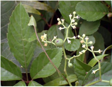
実をつけたヤブガラシは珍しい