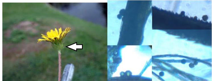
総苞外片（矢印）が反り返っていないが、花の時期が在来タンポポとは思えず、採集して顕微鏡で確認すると、花粉の粒径が不ぞろいで、外来タンポポもしくは在来タンポポとの交雑種である可能性が高い。