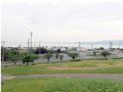
新夕陽ヶ丘の上からの見晴らし ケリが響く 210627