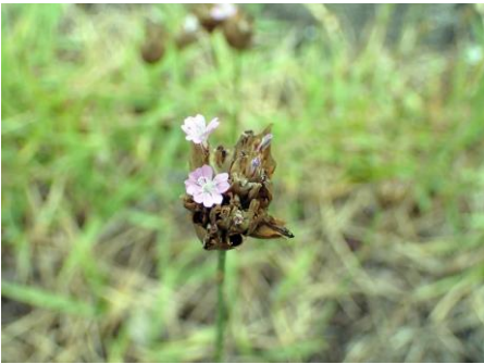
イヌコモチナデシコ 210627