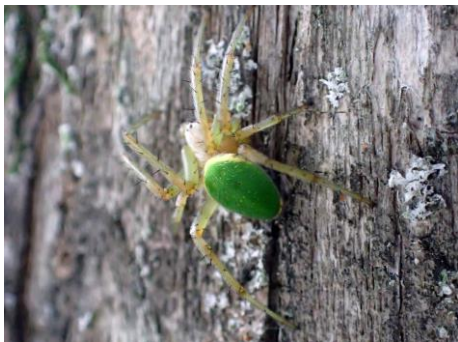
サツマノミダシ 210627

センニンソウ 1 ナミムカデゴケ 1 ニワゼキショウ 2 ノゲシ 2 ハマスゲ 2 ヒナキキョウソウ 3 ヒナノハイゴケ 1 ヘラオオバコ 2 マメカミツレ 3 ヤブガラシ 1 ヤブマメ 1 ヨモギ 1 外来タンポポの一種 2,3