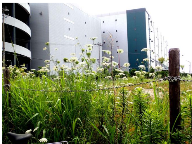
ノラニンジンの群生 210627 撮影 柗元慶子