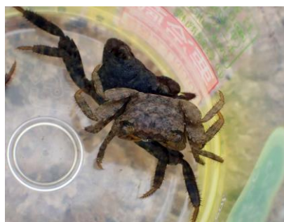
クロベンケイガニ 210627