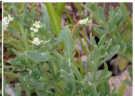
アレチムラサキ 南港でもよく見られる