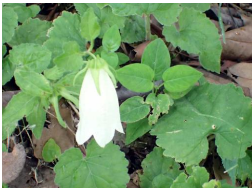
ホタルブクロは植栽から逸出したと思われる 210627