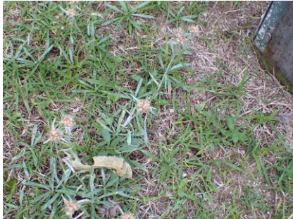
チチコグサ 芝地によく見られる 210627