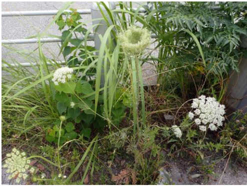
ノラニンジンはニンジンの野生種で港区内や南港 でよく見られる 210627 撮影 柗元慶子