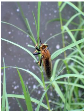
アオメアブ 210627