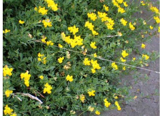
ミヤコグサとみられるマメ科の植物 一か所のみ見られた 210627