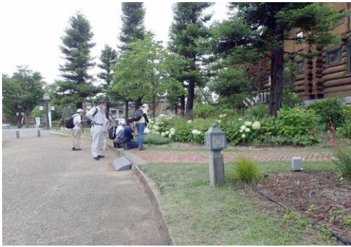
ログハウス内調査風景 210627