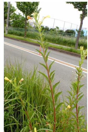
アレチマツヨイグサ 210627