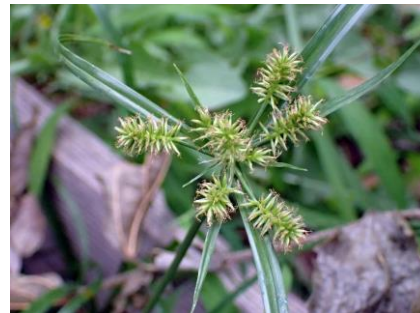
イヌクグ 210627