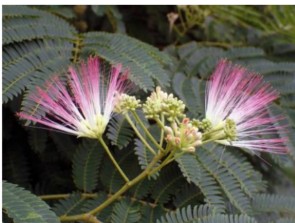
ネムノキ 210627