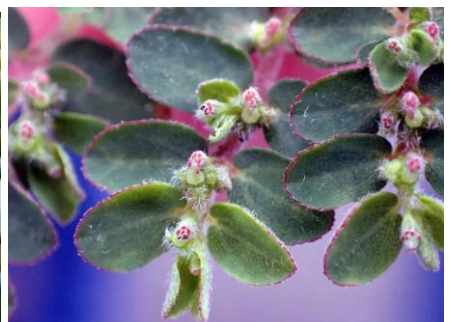
アレチニシキソウ 210627