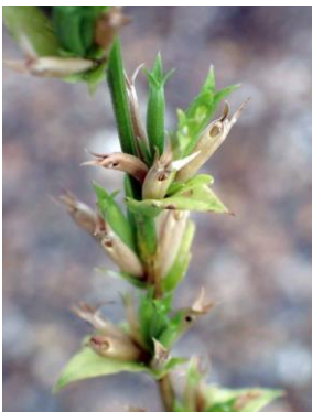
ヒナキキョウソウ