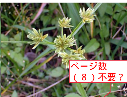
メリケンガヤツリ 210627