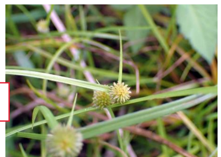
ヒメクグ 210627