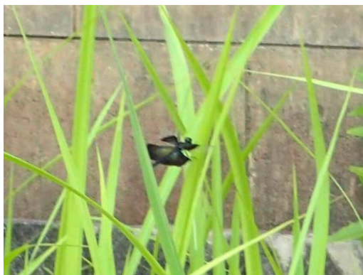
チョウトンポ 210627