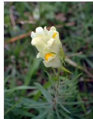
ホソバウンラン 210627