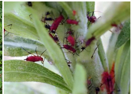
セイタカアワダチソウヒゲナガアブラムシ 210627