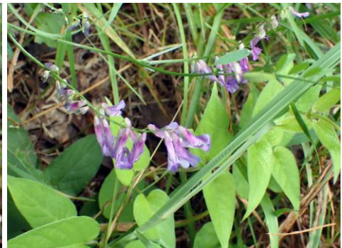
大和川、淀川で生息域を拡大してきたナヨクサフジはついに舞洲でも見られるようになった 210627