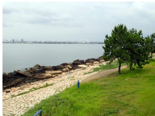
舞洲緑道 210627