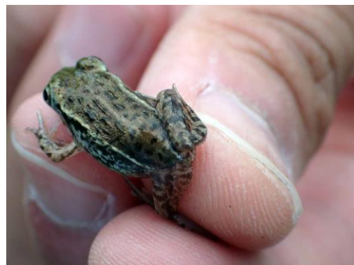
トノサマガエル 210627