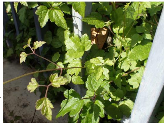
ボタンヅルが一面に広がっていた 中津小学校 201122