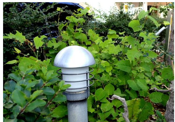
イタドリが植栽から伸びていた 201122