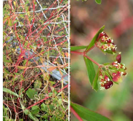
オオニシキソウがフェンス沿いの あちこちに出ていた 201122