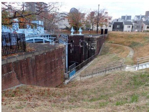
旧閘門は立ち入り禁止になっていた 周囲の芝地は養生中となっていた 201122