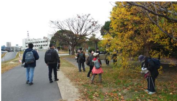
河川公園長柄地区 201122

動物…オオバン 4、ハシブトガラス 0 声、ハシボソガラス 4、ホシハジロ 4、マガモ 4