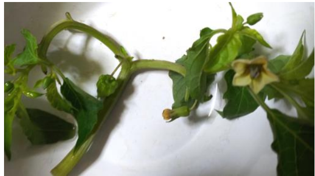
ヒロハフウリンホオズキ 201122