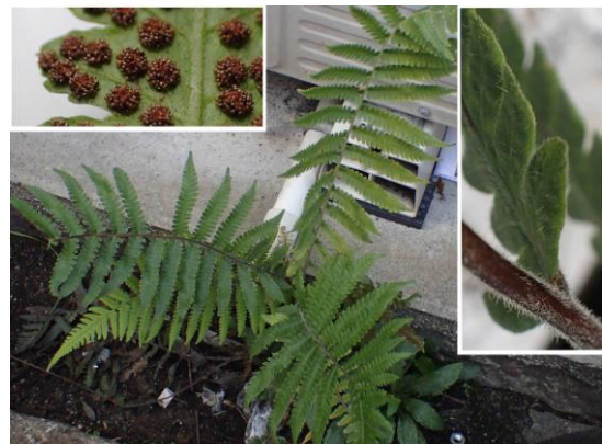
イヌケホシダ 201122

アサ科…エノキ 4 アブラナ科…タネツケバナ 3 イネ科…エノコログサ3、チガヤ 1 イノモトソウ科…イノモトソウ1 カタバミ科…オッタチカタバミ1、ムラサキカタバミ 1 カヤツリグサ科…メリケンガヤツリ3 キク科…ウラジロチチコグサ 1、オニタビラコ 2、 シロタエギク 1(植)、セイタカハハコグサ 2,3、 セイヨウタンポポ 3、ノゲシ 1、ヒメムカシヨモギ 3 クワ科…イチジク 4