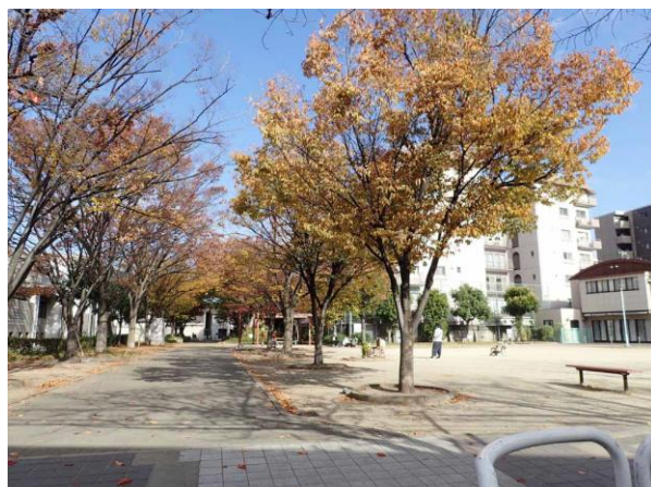
中津中央公園は野草が少なく乾燥している 201122