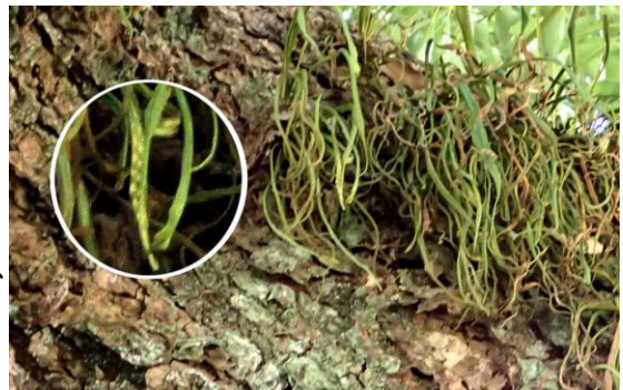
ノキシノブ 201122