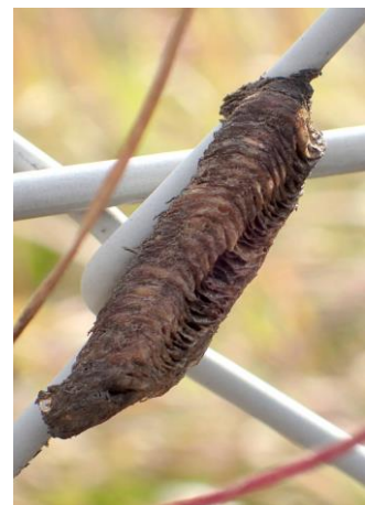
チョウセンカマキリの卵鞘 工事のフェンスに 201122