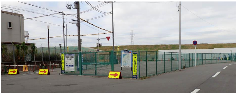
淀川左岸工事で立入禁止ゾーンが続く 201122