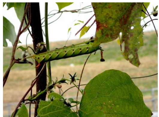
エビガラスズメの幼虫 201122