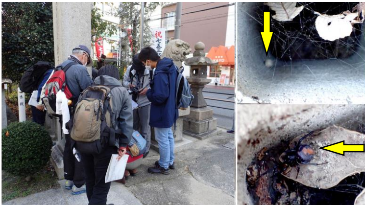
セアカゴケグモの卵囊右上と成虫右下 富島神社鳥居横 201122