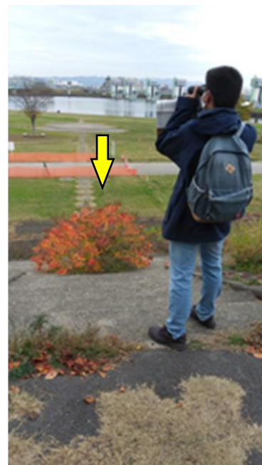
階段の真ん中には紅葉した ナンキンハゼが生えていた 201122