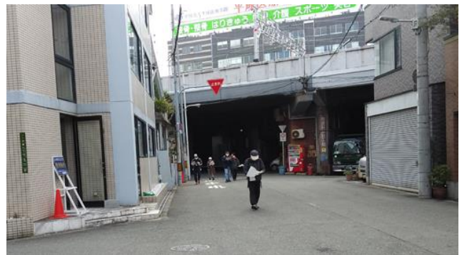
阪急の高架下から北へ曲がる 201122

アブラナ科…タネツケバナ 3 イネ科…エノコログサ 3(立枯れ)、コメヒシバ 3 ウコギ科…チドメグサ 1 カタバミ科…ハナカタバミ 2(植)、ムラサキカタバミ 1 キク科…オニタビラコ 2、セイタカハハコグサ 2、 ノゲシ 1、ヒロハホウキギク 3 クサスギカズラ科…ヤブラン 3(植) クスノキ科…クスノキ 1(植) トウダイグサ科…コムカンソウ 3 ドクダミ科…ドクダミ 1 ナデシコ科…オランダミミナグサ、ミドリハコベ 1 ハエドクソウ科…トキワハゼ 2 バラ科…ノイバラ 1 フウロソウ科…アメリカフウロ 1 マメ科…ヤハズエンドウ 1 動物…クスベニヒラタカスマカメ 0 食痕、ヒロヘリアオイラガ 0 羽化後繭、ネコハグモ 0 巣