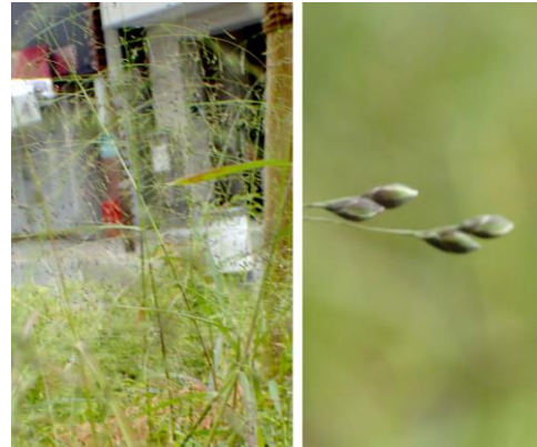
ヌカキビ: 近づかないと見えません 201122

カタバミ科…オッタチカタバミ1 キク科…ウラジロチチコグサ 1、オオアレチノギク 2,3、セイタカアワダチソウ 2、セイヨウタンポポ2、 チチコグサモドキ1、ノゲシ 1、ノボロギク 1 キンボウゲ科…ボタンヅル 1(大繁茂、中津小学校) クワ科…クワクサ 3 シソ科…ホトケノザ 1 スミレ科…スミレ sp.1 タデ科…イタドリ 1、イヌタデ 3 ツゲ科…セイヨウツゲ1(植、街路樹) ナス科…イヌホオズキ 2,3 ナデシコ科…ツメクサ sp.1、ミドリハコベ 1 ニレ科…アキニレ4 ヒガンバナ科…ハタケニラ 2 ヒユ科…ヒナタイノコズチ 3 ヒメシダ科…イヌケホシダ 1 フウロソウ科…アメリカフウロ 1 マメ科…ヤハズエンドウ 1 モチノキ科…ナナミノキ 3(植) ヤマモモ科…ヤマモモ 1(植、街路樹) 蘚苔類…ギンゴケ 1 地衣類…ダイダイゴケ科の一種 1、ナミムカデゴケ 1、 ムカデゴケ 1 動物…アワダチソウグンバイ 0 食痕、エノキワタアブラムシ 4、 クロマダラソテツジミ 0 食痕(ソテツ)、 ツゲノメイガ 0 食痕(セイヨウツゲ)、 ヒロヘリアオイラガ 0 羽化後繭、フタモンアシナガバチ 4、 ヤマトジミ 4、ルリチュウレンジ 2、クロガケジグモ 0 巣