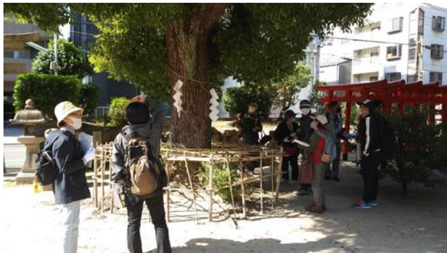
小さな一角に何種類もの野草が生えていた 富島神社のクス(ご神木) 201122