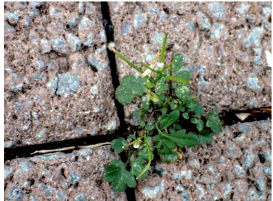
タネツケバナ 201122