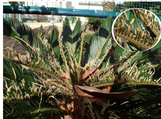
クロマダラソテツジミに食い荒らされたソテツ 中津小学校 201122