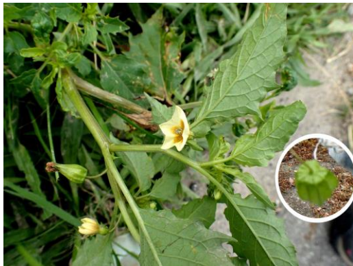
ヒロハフウリンホオズキ 201122

アブラバチ亜科の一種 3(モモコフキアブラムシ)、アブラムシ科の一種 4 (クズ)、イチモンジセセリ 4、 エビガラスズメ 2 (現場で種名が分からなかったもの)、クロヒラタア 4、ケブカアメイロアリ 4、シバズ 0 声、 チョウセンカマキリ 1、ツマグロキンバエ 4、ナナホシテントウ 4、ニホンミツバチ 4、ハラオカメコオロギ 0 声、 フトモンアシナガバチ 4、ホソヒラタアブ 4、マダラスズ 0 声、モモコフキアブラムシ 2,4(ヨシ)、 ヨモギワタタマバエ 2