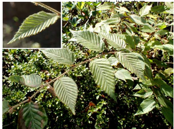
イヌシデと思われる実生の樹木 201122