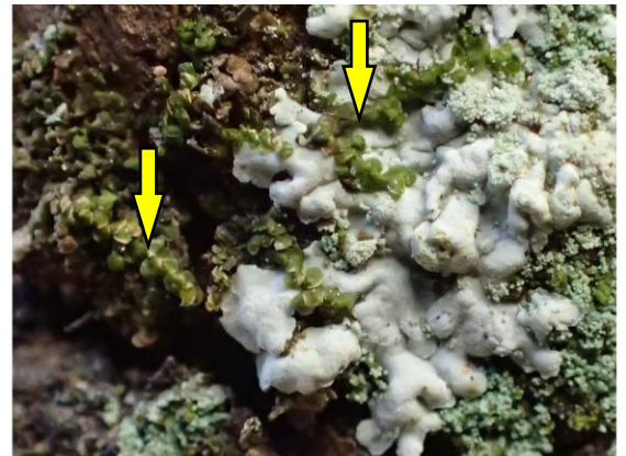
ヤスデゴケ sp.(矢印)と ナミムカデゴケ(白い粉芽塊)