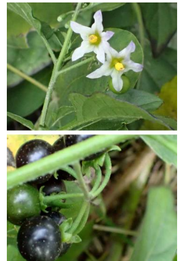
アメリカイヌホオズキ 201122