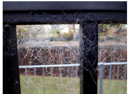
クロガケジグモの巣 201122

動物…アオサギ 4、カモメの一種 4(セグロカモメ?)、 カワウ 4、カンムリカイツブリ 4、ツグミ 4、ハシボソガラス 0 声、 ヒドリガモ 4、ヒヨドリ 4