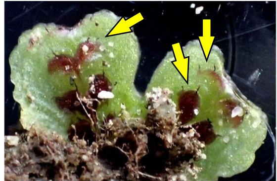
ジンガサゴケ 裏側にはあの「トトロ」が たくさん見えます 201122