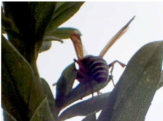
フタモンアシナガバチ 201122