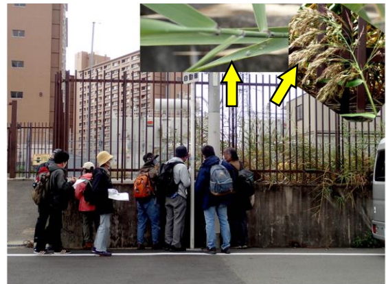
ヨシ 201122