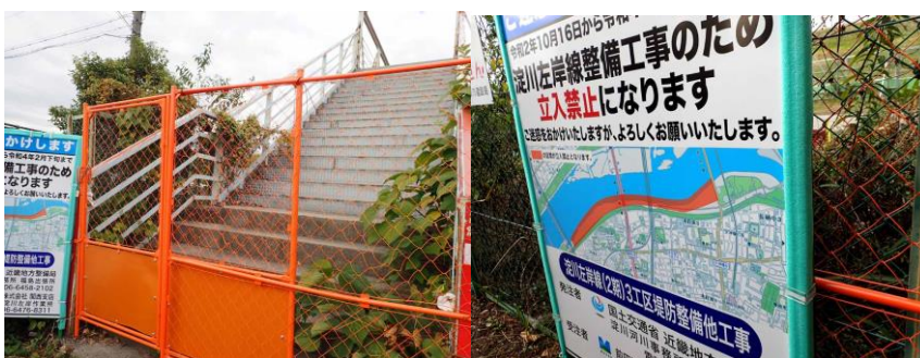
豊崎一之橋は通行止めになっていた 201122