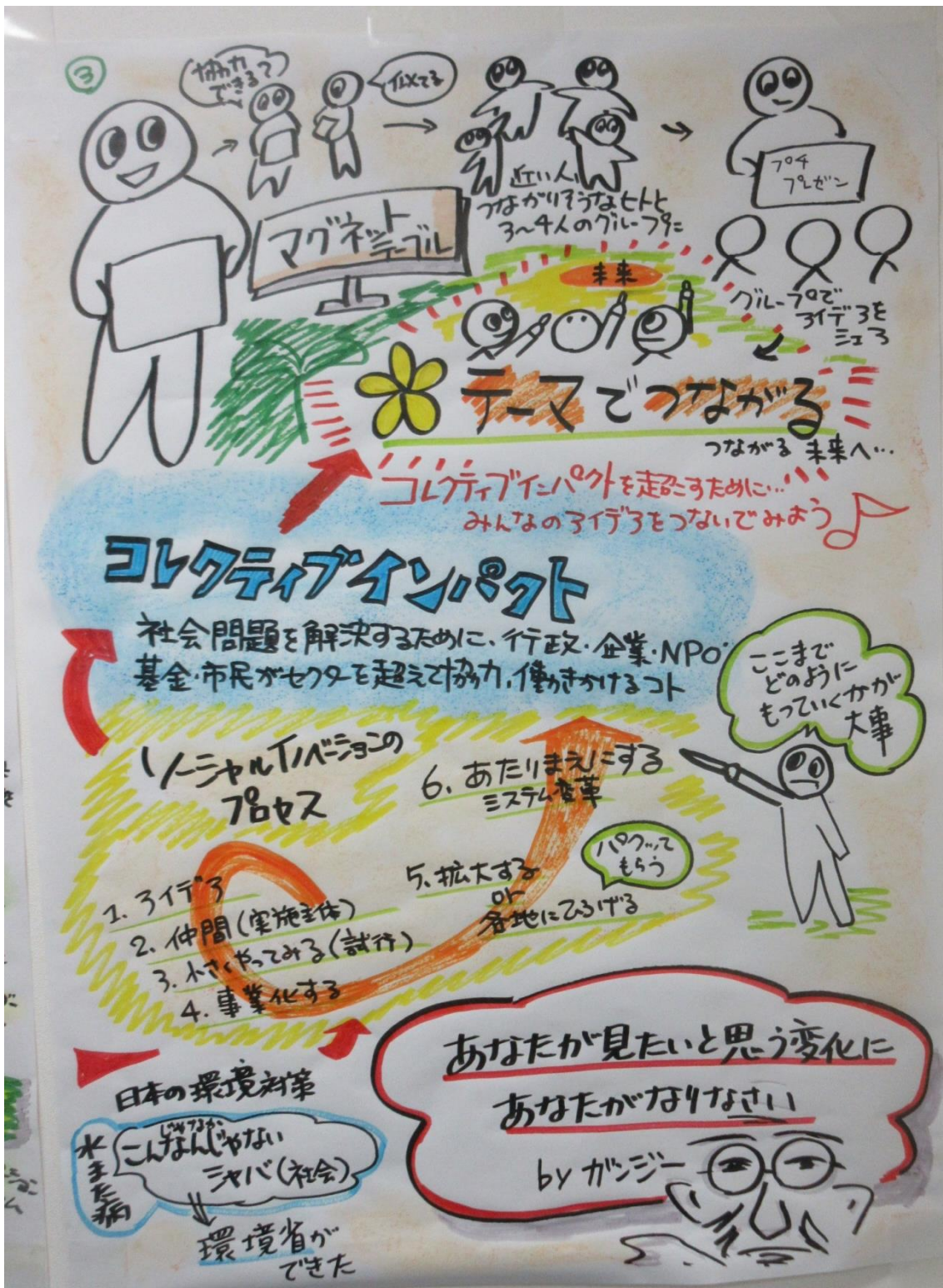
参考—グラフィック・レコーダーによる現場での見える化③