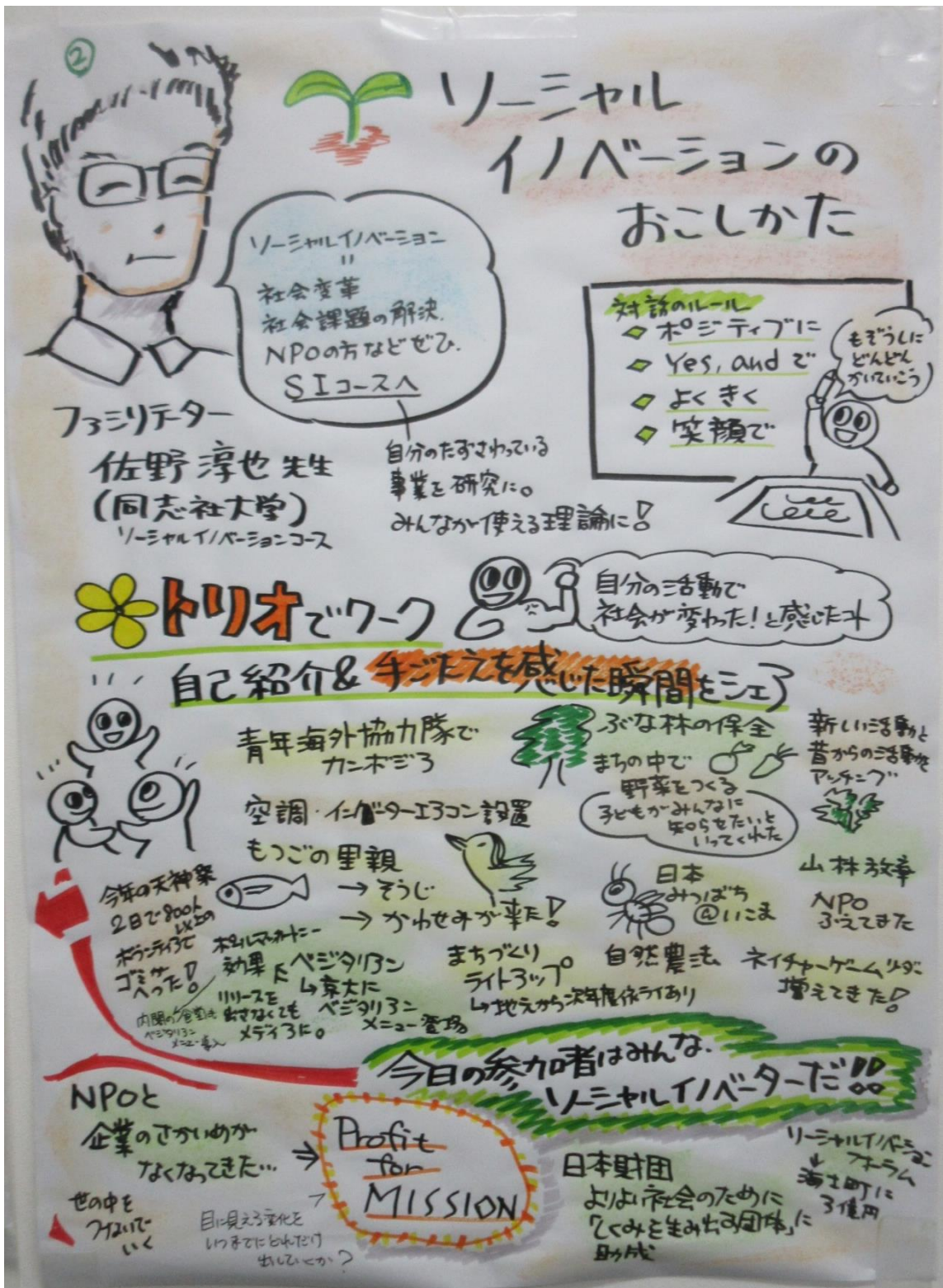
参考—グラフィック・レコーダーによる現場での見える化②