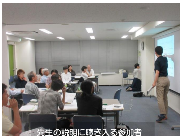
先生の説明に聴き入る参加者

次にソーシャル・イノベーションの起こしかたですが、①アイデアを思いつく、②仲間を集める/グループをつくる、③試にやってみる、④事業化する/ビジネス化する、⑤事業を拡大する/各地に広げる、⑥システム変革(意識変容/制度化/産業化)、以上、6つのステージを経て社会への定着を図っていくとのことでした。