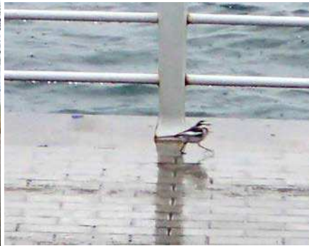
雨の中歩くハクセキレイ 161127