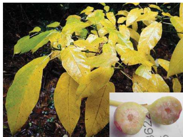
イヌビワは黄葉が始まり、実を割ってみました。イヌビワコバチはいませんでした。161127 撮影 榎元慶子

アカバナ科…メマツヨイグサ 1 イネ科…ススキ 1 イラクサ科…カラムシ 1 カヤツリグサ科…ハマスゲ 3 キク科…コセンダングサ 1、ヨモギ 1 ツバキ科…カンツバキ 2(植) ツユクサ科…ツユクサ 1、マルバツユクサ 1 トウダイグサ科…コニシキソウ 3 ニガキ科…ニワウルシ 4 バラ科…シャリンバイ 3(植)