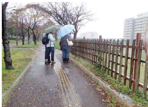
最後まで雨が降っていました。 161127