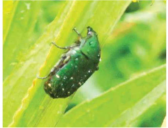
ハナムグリの一種 161127