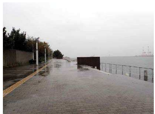
コスモスクエア海浜緑地 161127