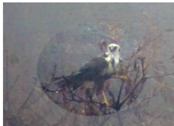
チュウヒもいました 161127

アカバナ科…メマツヨイグサ 1 キク科…セイヨウタンポポ 2 ツバキ科…カンツバキ 2(植) トウダイグサ科…コニシキソウ 3 バラ科…シャリンバイ 3(植) 動物…ミダレカクモンハマキ 4