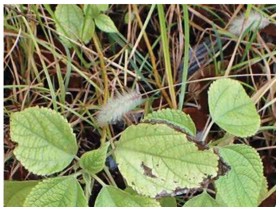
中央の白い穂はハマエノコロ 下の緑の葉はカラムシ 161127