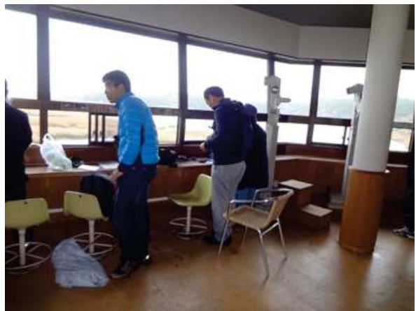
野鳥園展望塔内 161127