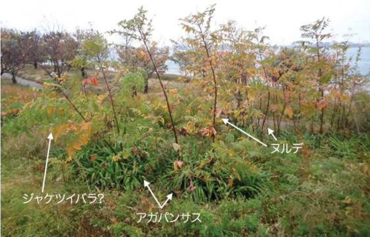
アガパンサスの中からヌルデやジャケツイバラ?の実生がでていました。ヌルデはその辺り一帯たくさんでていました。 161127