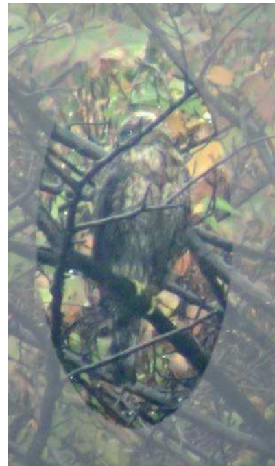
展望塔内の双眼望遠鏡でオオタカ(若鳥)をみました。161127

アカネ科…ヘクソカズラ 1 イネ科…ススキ 3、スズメノカタビラ 2、タチスズメノヒエ 2、 ハマエノコロ 3(立枯れ)、メリケンカルカヤ 3 オオバコ科…オオバコ 3 カタバミ科…カタバミ 1 キク科…コセンダングサ 2,3、セイタカアワダチソウ 2、 ノゲシ 2、ヒメジョオン 1、ヨモギ 3 タデ科…アレチギシギシ 1 ナス科…イヌホオズキ 2 ナデシコ科…オランダミミナグサ 1 ヤマゴボウ科…ヨウシュヤマゴボウ 2,3 動物…オオタカ 4、オオバン 4、オカヨシガモ 4、 オナガガモ 4、カイツブリ 4、コガモ 4、ハシビロガモ、 マガモ 4、アブラゼミ 0 羽化殻、スズバチ 0 巣、 クロガケジグモ 4