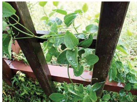
柵にからまっていたセンニンソウ 161127