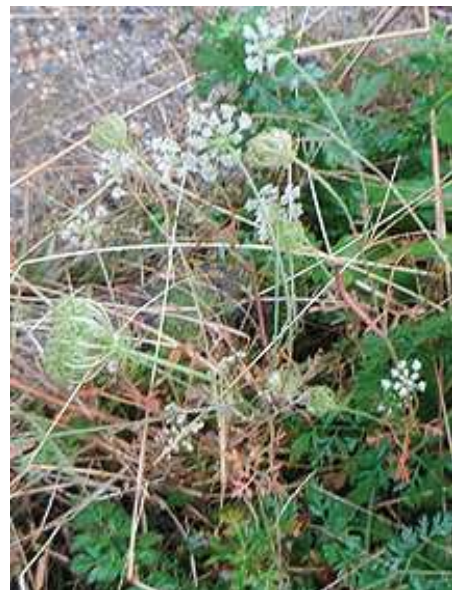
ノランジン 161127