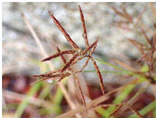
ハマスゲ 161127