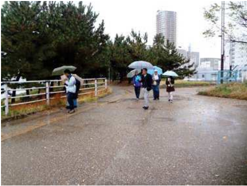
雨の中の調査 161127

動物…スズメ 4、ハクセキレイ 4、ハシボソガラス 4、ヒヨドリ 4、ヒロヘリアオイラガ 4、マツカレハ 2 繭