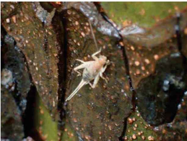
カネタタキ 161127