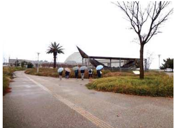
もとなにわの海の時空館前 161127

アカネ科…ヘクソカズラ 1 イネ科…コツブキンエノコロ 3、ススキ 3 カタバミ科…オッタチカタバミ 2 キク科…アキノノゲシ 2、セイタカアワダチソウ 1,2、 ノゲシ 1、ヒメジョオン 2、ヨモギ 1 ゴマノハグサ(オオバコ)科…ホソバウンラン?2 ツバキ科…カンツバキ 2(植) ブドウ科…ヤブガラシ 1 ブナ科…アラカシ 3(植) マメ科…アレチヌスビトハギ 3、カラスノエンドウ 1 動物…ヒヨドリ 0 声、カネタタキ 4、ジョロウグモ 4