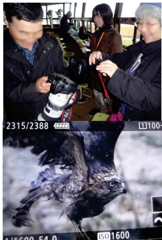
来園者が写したオオタカをさらにデジカメで写させていただきました。161127

アカネ科…ヤエムグラ 1 イネ科…オヒシバ 3 カタバミ科…オッタチカタバミ 1