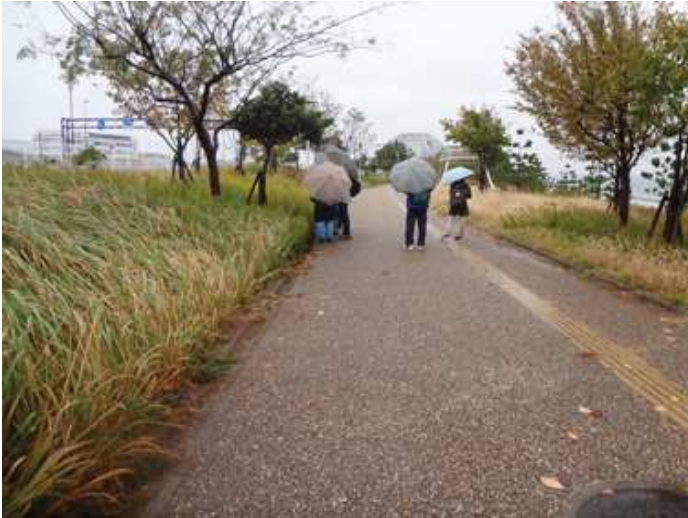
元の植栽がどのようなだったかわからなくなっていました。一種がそれぞれ群生し、色の違いでその境界がわかります。左:手前からチガヤ、セイタカアワダチソウ、オオニシキソウ。右:エノコログサ、セイタカアワダチソウ、エノコログサ 161127