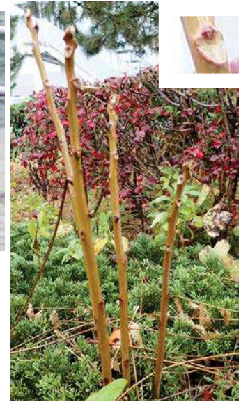
ニワウルシの冬芽 161127