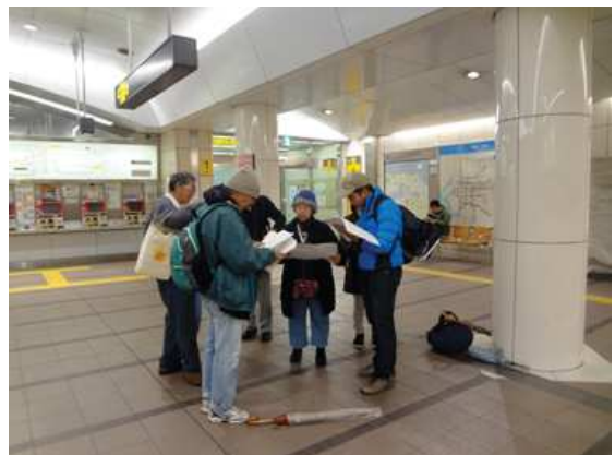
コスモスクエア駅 161127