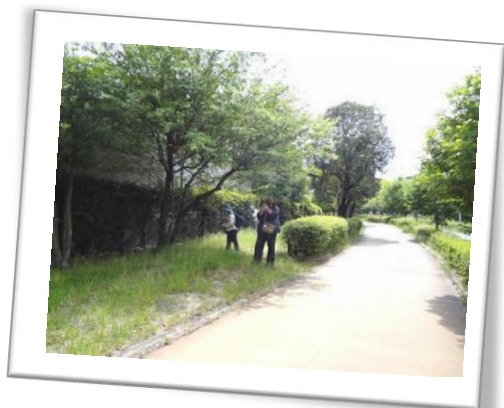
大野川緑道：ゆっくりと歩きましょう。

都市での生物多様性を保全していくための手がかりとなる基礎データづくりです。調査には、毎回教えてくださる専門家の方が来られます。初めての方でも、調査しながら学べます。