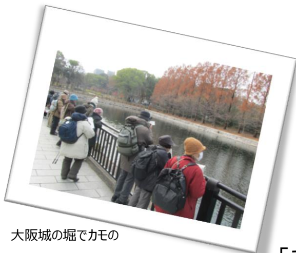
大阪城の堀でカモの種類を調査