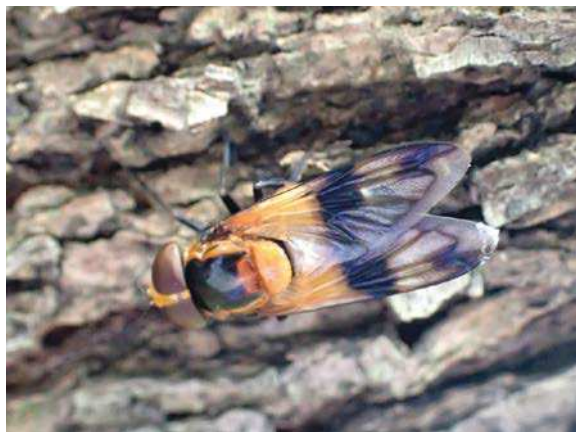
幹の下側で雨をよけるシロスジベッコウハナアブ 171015