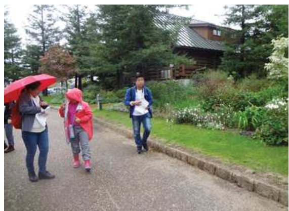
3 植栽が多様なロッジ舞洲 171015