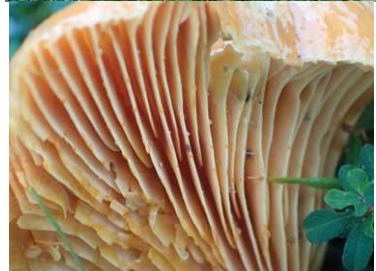
不明のキノコ C 舞洲緑道 No.444 171015