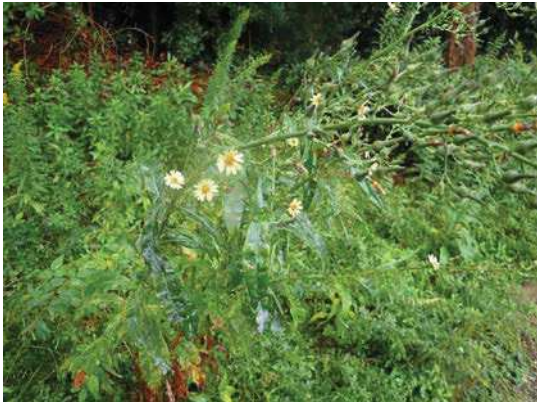
アキノゲシ 171015