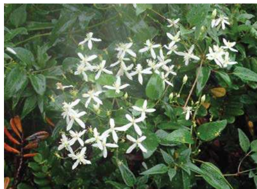
センニンソウ 171015