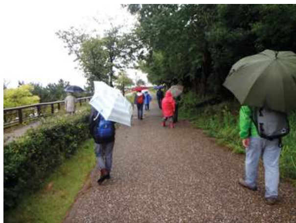
雨は最後まで降り続け、調査用紙はぬれてボロボロでした。171015