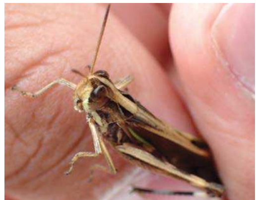
マダラバッタ 刈り込まれて乾燥した草地に よく見られる 171015