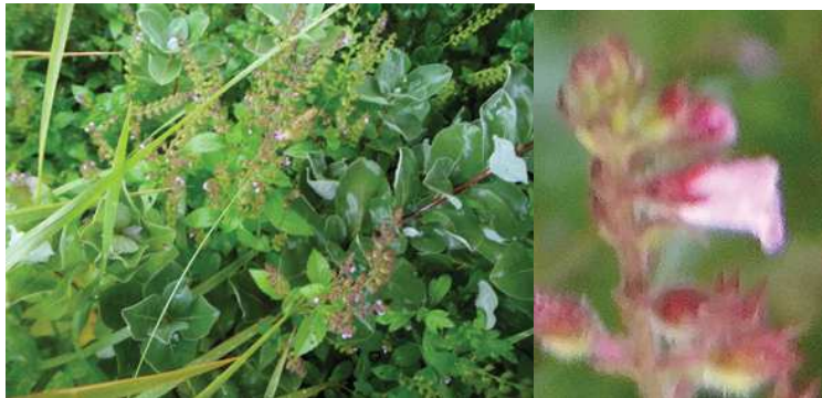
イヌコウジュ:ハマゴウの中から飛び出ていました。

動物…カワウ 4、キジバト 4、ダイサギ 4、ハシブトガラス 4、 ヒヨドリ 0 声、アカハネオンブバッタ 4、ショウリョウバッタ 4、 ハラオカメコオロギ 0 声、マダラバッタ 4