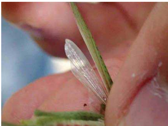
オンブバッタ 171015