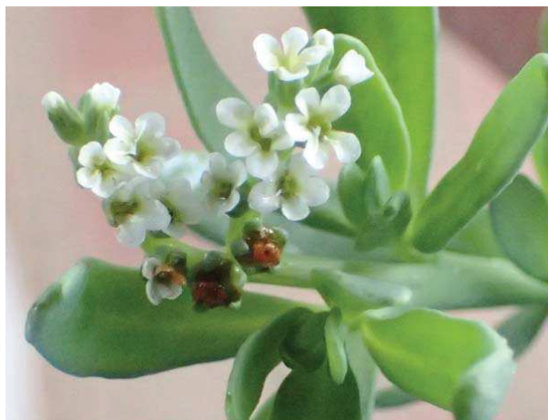
侵入生物として登録されているアレチムラサキ 舞洲には定着か 171015