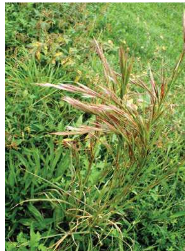
フトボリケンカルカヤ? 171015