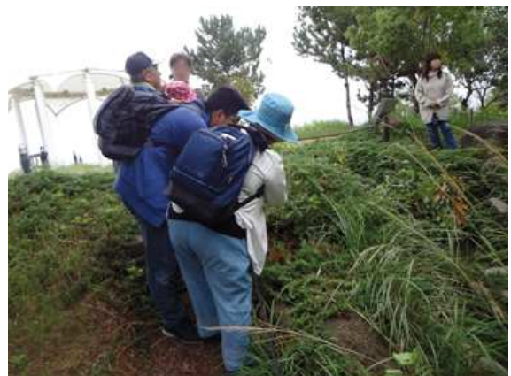
新夕陽ヶ丘頂上手前 171015 撮影 北川ちえこ