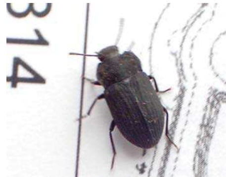
スナゴミムシダマシ sp 171015 撮影 榎元慶子