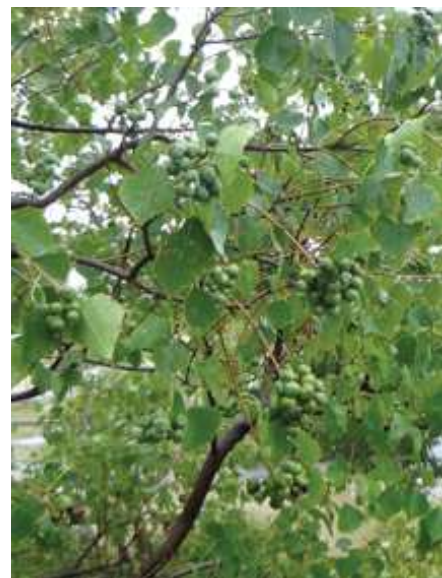
ナンキンハゼ:この辺りには実生のナンキンハゼのほかアキニレやトウネズミモチが立ち並び実も沢山できていました。 171015