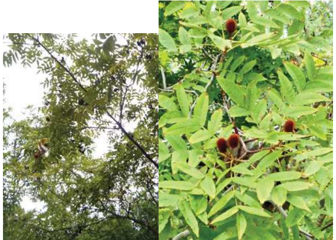
実生と思われるノグルミに実が沢山ついていました。 171015

アカネ科…ヘクソカズラ 1 アブラナ科…マメゲンバイナズナ 3 イネ科…アキメヒシバ 2、エノコログサ 3(立枯,多い)、 セイバンモロコシ 3、タチスズメノヒエ 3、 フトボメリケンカルカヤ 2、メヒシバ 3(斜面に群生) オオバコ科…ヘラオオバコ 2 カタバミ科…カタバミ 2 カヤツリグサ科…クグガヤツリ 3 キク科…アメリカセンダングサ 3、 セイタカアワダチソウ 2、セイヨウタンポポ 2,3、 チチコグサ 2、ヒメムカシヨモギ 2、ヨモギ 2 キョウチクトウ科…テイカカズラ 2 クスノキ科…クスノキ 1 クマツヅラ科…アレチハナガサ 2 グミ科…ナワシログミ 2 クルミ科…ノグルミ 3 ツユクサ科…ツユクサ 2 ニシキギ科…マユミ 3(植) ニレ科…アキニレ 3 バラ科…シモツケ 2(植) ハンノキ科…ハンノキ 3(植) ススキノ科…キスゲ sp? 2 マメ科…アレチヌスビトハギ 2,3、シロツメクサ 2 ヤナギ科…ポプラ 4 動物…キビタキ 4(雌)、トビ 4(上空)、ハクセキレイ 4、ムクドリ 4、モズ 4、イラガ 3(繭,ハンノキに)、クスベニ ヒラタカスミカメムシ 0 食痕、シロスジベッコウハナアブ 4