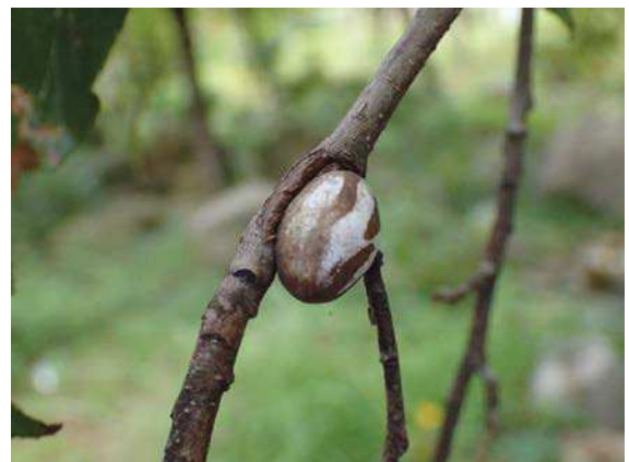
イラガの繭 171015

メッシュ No.52353912(501) (新夕陽ヶ丘)～舞洲野外活動センター入口 オオバコ科…フラサバソウ 1 トウダイグサ科…コニシキソウ 3 動物…ヒヨドリ 4