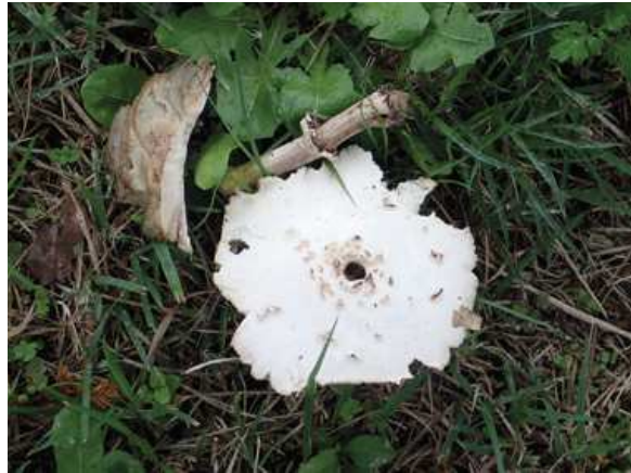
オオシロカラカサタケ:もともとは熱帯地方に分布するキノコ 温暖化で北上中といわれる 171015