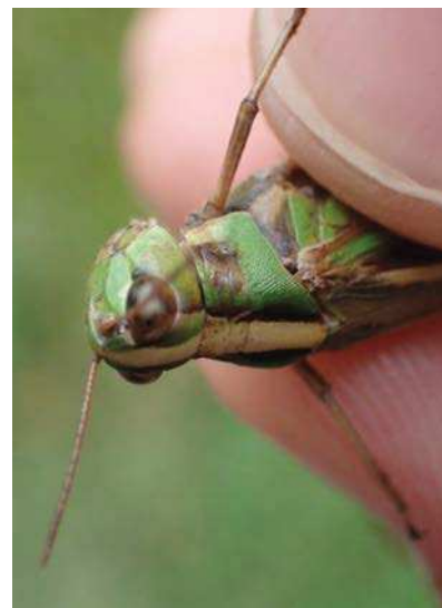
マダラバッタ 雨の中逃げるところを捕まえられた。171015