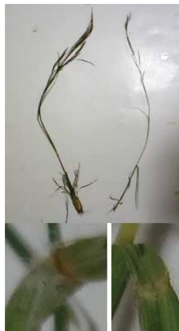
フトボメリケンカルカヤは最近知った植物で、見た目がメリケンカルカヤとは明らかに違いましたが、その場では同定点が分かりませんでした。一株家に持ち帰りルーペで葉舌を見ました。 右:メリケンカルカヤ:葉舌がはっきり分かりました 左:フトボメリケンカルカヤ:葉舌は分かりにくくその上には毛が並んで生えていました ※へたな写真では分かりにくいですが 171015 撮影 北川ちえこ