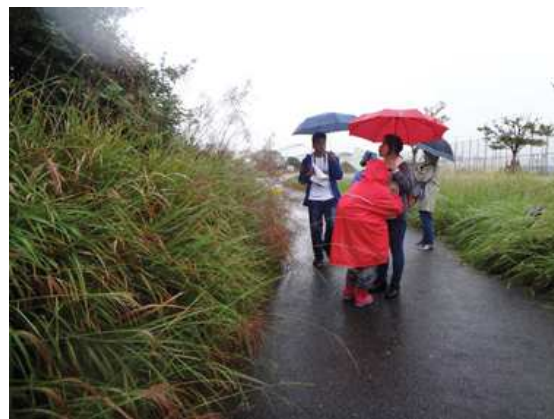
ススキ(左の群生)は唯一この辺りにしか見つけれませんでした。右側にはセイバンモロコシが同じように生えていましたが、ここまでのコースでも見たのはセイバンモロコシばかりで以後も同じでした。 171015