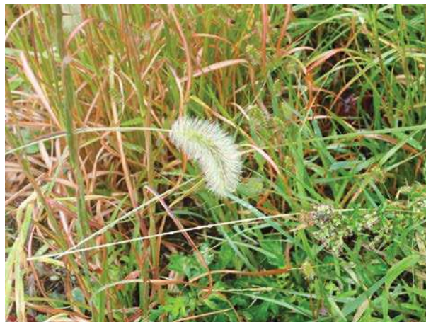
ハマエノコロ 171015