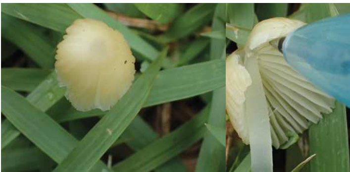
不明種キノコ B2 171015