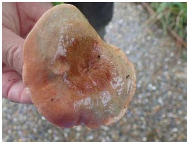
アカハツ? 171015