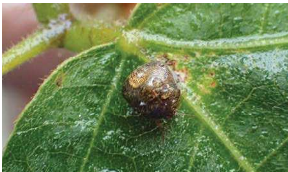
雨に打たれるマルカメムシ 171015

オートキャンプ場北側通路 イネ科…キンエノコロ 3、ススキ 2、タチスズメノヒエ 2 キク科…セイタカアワダチソウ 2 グミ科…ナワシログミ 2 バラ科…トキワサンザシ 3、ノイバラ 3 マメ科…クズ 1、マルバヤハズソウ 3、メドハギ 1 動物…エンマコオロギ 0 声、ハラオカメコオロギ 0 声、 マルカメムシ 4