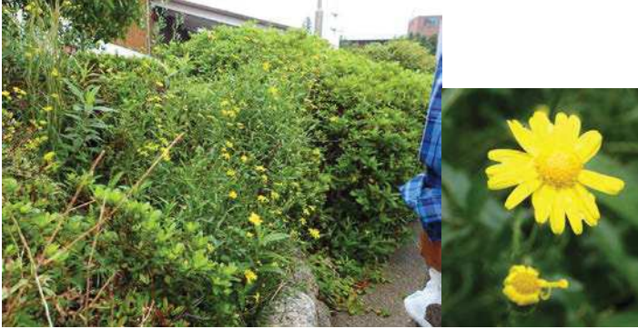
特定外来種ナルトサワギク: ロッジ舞洲前にも、道路をはさんで 向かいの新夕陽ヶ丘側のバス停横にも広がっていた。 放置すると拡大する。171015

キク科…ヨモギ 2 スイカズラ科…ハナツクバネウツギ 2(植) ツユクサ科…ツユクサ 2 マメ科…クズ 1 キノコ類…キノコ spB2 動物…スズメ 4、ハシボソガラス 4、 スナゴミムシダマシ sp4、マダラバッタ 4、 ヤマトシジミ 4、ヨモギワタフシ 4