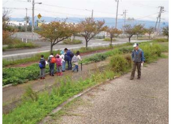
新夕陽ヶ丘の坂を上る 171015