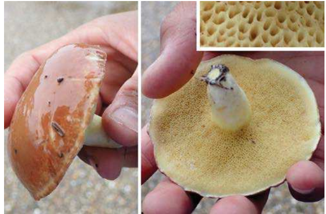
チチアワタケ 171015

メッシュ No.523537924(474) 舞洲スラッジセンター横 動物…鳥の一種 0 巣跡(キジバト?)