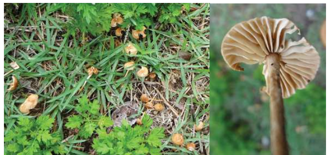
不明のキノコ A2 新夕陽ヶ丘 No.501 171015