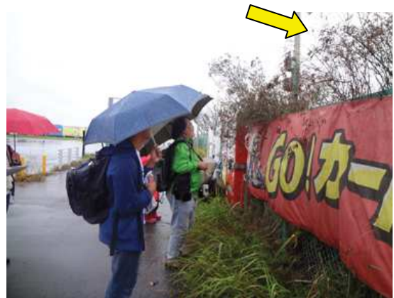
フェンスを越すほどに伸びたアレチハナガサ 171015