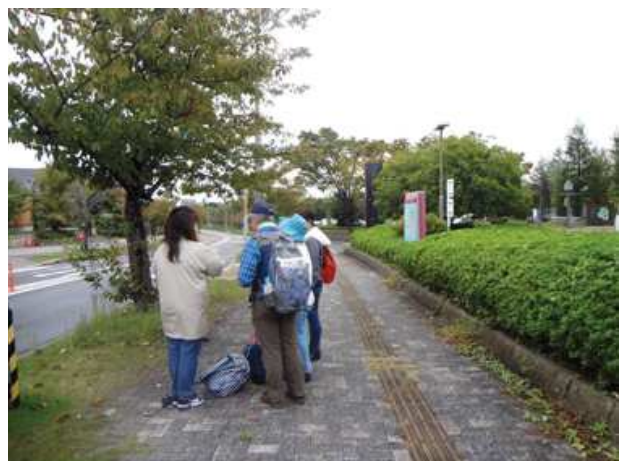
集合したころはまだ雨は降っていませんでしたが、新夕陽ヶ丘を降りたころから降ってきました。