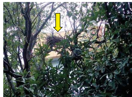
キジバトの巣か 舞洲スラッジセンター横 171015