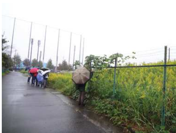
一度刈られてから再び生えてきたセイトカアワダチソウの花は、黄色が大変きれいで、その群生は見事でした。 171015