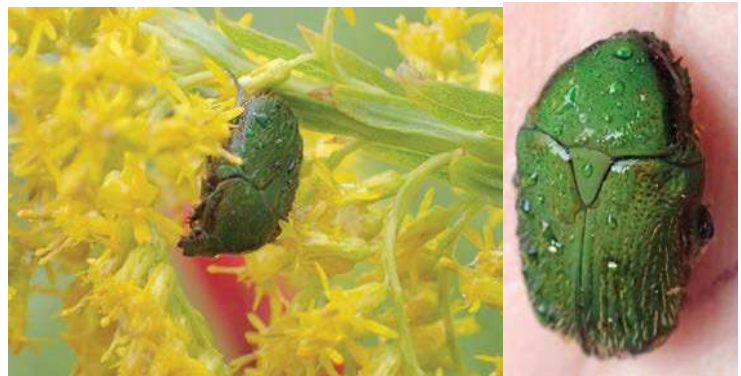
セイタカアワダチソウの花の中にアオヒメハナムグリがいました。 冷たい雨で動きは鈍かったです。 171015