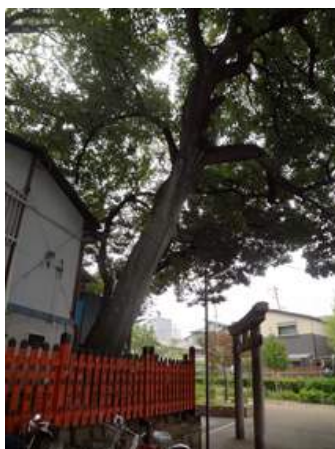
明神の裏手に、大きなアベマキがありました。151011