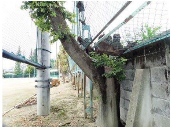
エノキ？(昭和中学グラウンド):どこで支えられているのか、ちょっとシュールです。桃ヶ池にはこんな風景があちこちにありそうな、異次元の趣があります。(北川) 151011