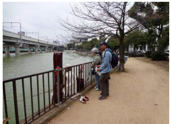
長池:釣り人と話を交わす調査者ですが、こうして現地の方と話をするのも、現地を知る大切な情報収集です。 151011