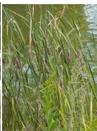
ガマ 151011