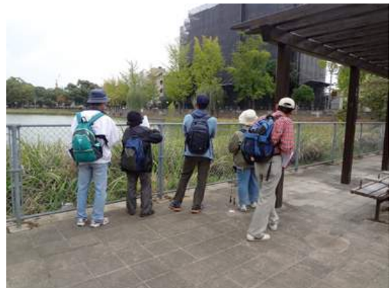
長池 151011