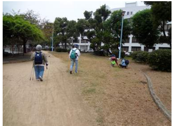
山坂公園 151011