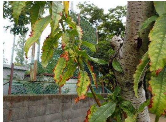
かろうじて残った桃の木も、葉が縮れて、病気の疑いがある。:桃ヶ池公園 151011