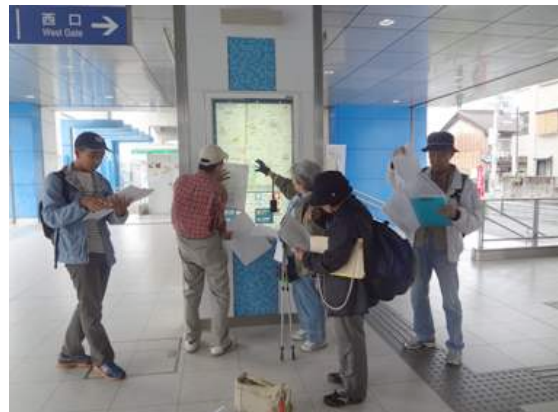
JR南田辺駅集合 151011