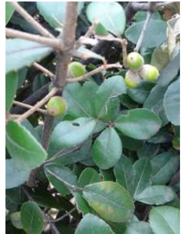
ウバメガシ 151011

ツククサ科…マルバツククサ 2 ナス科…イヌホオズキ 1 ヒルガオ科…アオイゴケ 1 ブナ科…ウバメガシ 3(植) マメ科…シロツメクサ 1 動物…アオサギ 4、スズメ 4、ドバト 4、ハクセキレイ 4、ハシボソガラス 4、 エンマコオロギ 0 声、カネタタキ 0 声、カミナリハムシ 4、 クマゼミ 0 羽化殻、ハラオカメコオロギ 0 声、チャコウラナメクジ 4、 フナ 4(釣っていた釣り人によると、過去に池に放流されたようです)