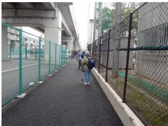
JR南田辺駅高架下 151011