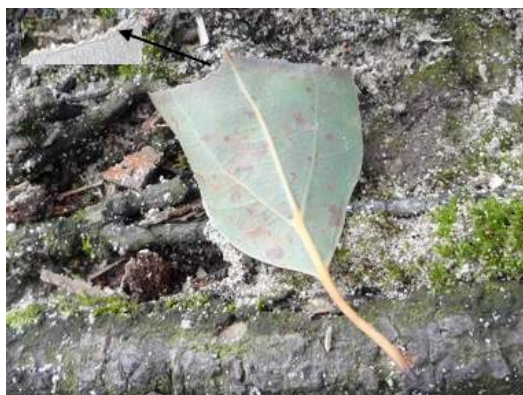
クスノキの葉にアオスジアゲハ幼虫の食痕: 幼虫が食べたあとは葉がぎざぎざになっています 151011