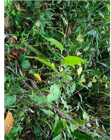
ボントクタデ 151011