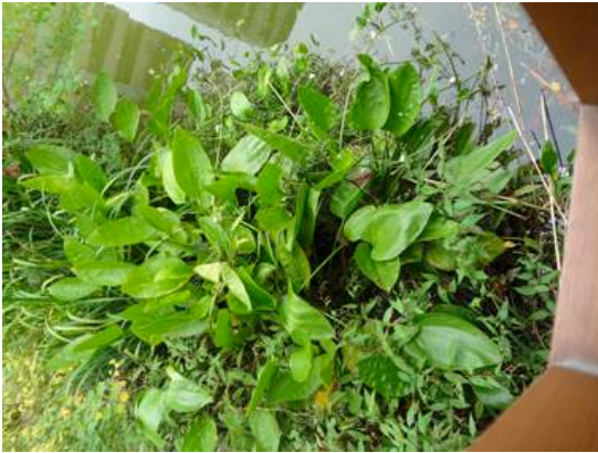
サジオモダカ(植栽?) 151011