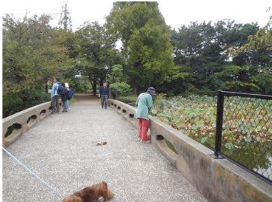
桃ヶ池のこの一角には沢山のハスが見られます。151011 撮影 北川ちえこ

アカネ科…ヘクソカズラ 1 アカバナ科…メマツヨイグサ 2 イチョウ科…イチョウ 3 イネ科…イヌビエ 3、イヌムギ 2(立枯れ)、オヒシバ 2,3、 キンエノコロ 3、ススキ 2、チカラシバ 2、ネズミノオ 2、 メヒシバ 3、ヨシ 2 オモダカ科…サジオモダカ 2(植?) カタバミ科…オッタチカタバミ 2 ガマ科…ガマ 2(植?) カヤツリグサ科…ヒメグサ 2 キク科…アキノノゲシ 2、アメリカセンダングサ 2、 アレチノギク 2、オオアレチノギク 2、 セイタカアワダチソウ 2、ノゲシ 2、ヒメムカシヨモギ 2、 ヨモギ 2 スイカズラ科…ハナツクバネウツギ 2(植) セリ科…ドクゼリ 1 タデ科…イヌタデ 2、オオイヌタデ 2、ポントクタデ 2 ツユクサ科…ツユクサ 2 トウダイグサ科…ナンキンハゼ 3 ナス科…イヌホオズキ 2 ヒルガオ科…マルバアメリカアサガオ 2,3 マメ科…アレチヌスビトハギ 2、コメツブツメクサ 1 動物…アオサギ 4、カルガモ 4、キジバト 4、ゴイサギ 4、ドバト 4、マガモ?(アヒル?)4、 アオスジアゲハ 0 食痕(クスノキの落ち葉)、アザミウマ 4、エノキワタアブラムシ 4、エンマコオロギ 0 声、 カネタタキ 0 声、キタキチョウ 4、キマダラカメムシ 2、クマゼミ 0 羽化殻、シバズ 0 声、 チョウセンカマキリ 4、テントウムシ sp2、ハサミムシ 4、ハラオカメコオロギ 0 声、ヒメヒラタアブ sp4、 モンシロチョウ 4、ヤマトシジミ 4