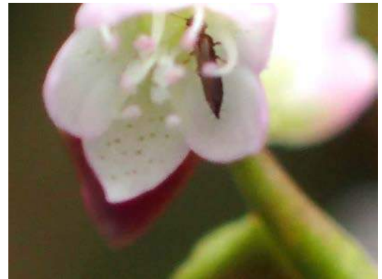
ボントクタデの花の中にアザミウマ 151011 撮影 榎元慶子