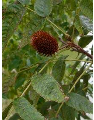
ノグルミ:近年、淀川の大坂上流の河川敷造成地にもノグルミの実生が沢山でると聞きました。 151011 撮影 北川ちえこ

イネ科…オヒシバ 3、チヂミザサ 2 キク科…ウラジロチチコグサ 1、チチコグサモキ 2、 ノゲシ 1、ヒメムカシヨモギ 2、ヨモギ 2 クワ科…イヌビワ 4 ヒユ科…ヒナタイノコズチ 1 モクセイ科…キンモクセイ 2(植)、トウネズミモチ 3(植)