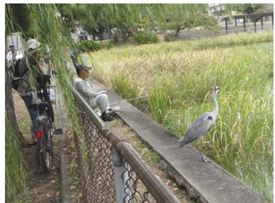
魚が釣り上げるのを待っているアオサギ:人間の寛容さが鳥との信頼関係を生んでいるのでしょうか。でも、ここでも微妙な距離感があるように思います。偶然に撮れたのですがその緊張感が何となくわかる写真でした。距離が無くなるのは夢ですが、やはり夢で終るのでしょうか。