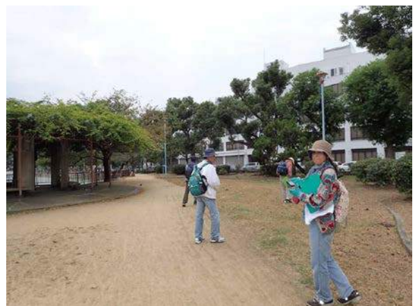
長池での調査風景 151011