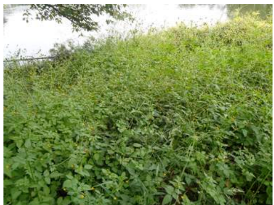
コセンダングサ:池のそばでしたのでアメリカセンダングサかと思い込んでいましたが近寄って良く見るとコセンダングサでした。151011