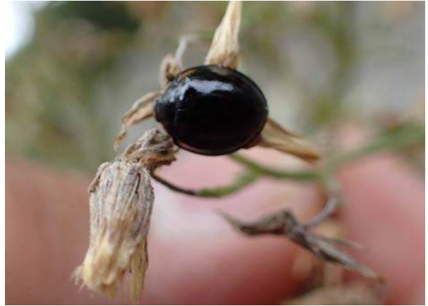
ダンダラテントウ 151011