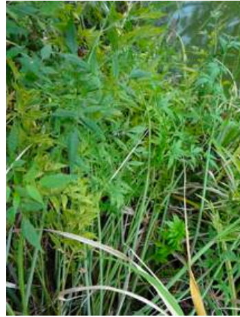
ドクゼリ 51011