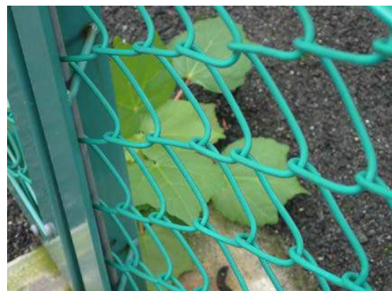
フェンス内にアカメガシワの実生 151011