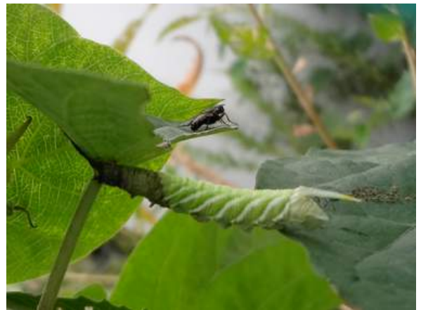
エビガラスズメ幼虫:もう死んでいました。スズメガの幼虫はみんな似ていて分からなかったのですが、中谷さんの同定ではアサガオにいたのが決め手になりました。ハエがセットで写っていたのは、ハエが偶然にいたのではなく、幼虫の死臭に誘われてきたのかもしれない。※中谷さんは他のイベントへ参加していた為、終了後合流し、分からなかった虫の同定をしていただきました。151011 撮影 北川ちえこ

アオイ科…タチアオイ 3(植) アカバナ科…コマツヨイグサ 2、メマツヨイグサ 3 アブラナ科…タネツケバナ 1 イネ科…エノコログサ 3、オヒシバ 3、コメヒシバ 2、シマズメノヒエ 2、ニワホコリ 3、メヒシバ 3 オシロイバナ科…オシロイバナ 2 カタバミ科…オッタチカタバミ 2 カンナ科…カンナ 2(植) キク科…ウラジロチチコグサ 1、セイタカアワダチソウ 2、 セイタカハハコグサ 2、セイヨウタンポポ 2、ノゲシ 1、 ヒメムカシヨモギ 2、マメカミツレ 2 クワ科…クワクサ 2 スベリヒコ科…スベリヒコ 2 タデ科…ナガバギシギシ 3 トウダイグサ科…コニシキソウ 2,3 ナス科…ワルナスビ 3 ナデシコ科…オランダミミナグサ 1 ヒガンバナ科…タマスダレ 2(植) ヒユ科…ヒナタイノコズチ 1 ヒルガオ科…アオイゴケ 1、アメリカンブルー 2,3(植) モクセイ科…ネズミモチ 3(植) ヤマゴボウ科…ヨウシュヤマゴボウ 3 動物…スズメ 4、ドバト 4、エビガラスズメ 2(死体、 アメリカンブルーの葉に)、オンブバッタ sp4、 カネタタキ 0 声、クマゼミ 0 羽化殻