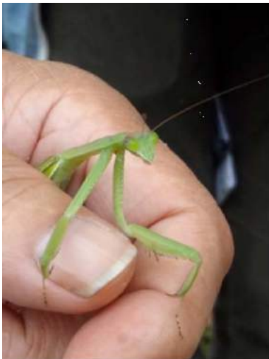
チョウセンカマキリ 151011