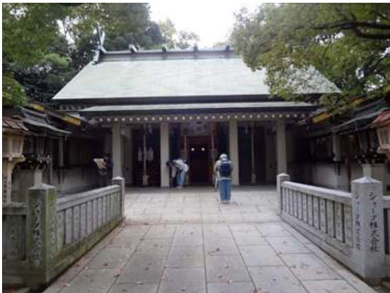
山坂神社:日露戦争碑のある神社でした。石橋にシャープの文字が見え、この地はシャープの本社がある(長池のそば)ところだったことを思い出しました。 151011