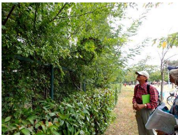
JR 高架下の実生林 151011