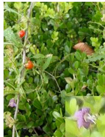
クコ 151011

桃ヶ池公園東外周 歩道 アカザ科…シロザ 2 アカネ科…ヘクソカズラ 3 アブラナ科…セイヨウカラシナ 1 イネ科…イヌムギ 2(立枯れ)、エノコログサ 3、コメヒシバ 2 ウルシ科…ヌルデ 4 オシロイバナ科…オシロイバナ 2 キク科…セイタカアワダチソウ 2 クルミ科…ノグルミ 3 クスノキ科…クスノキ 3 ツユクサ科…マルバツユクサ 2 クマツヅラ科…クサギ 2