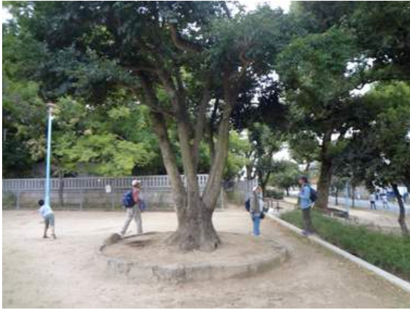
山坂公園:山坂神社の鎮守の森だったのでしょうか。1本曲がった大きなクスノキが印象的でした。程よく登りやすくなっているこの木は、今も昔も多くの子供達の遊び場になっているのでしょうか。 151011