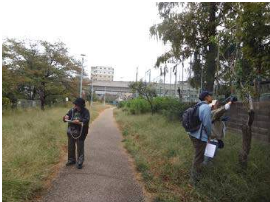
桃ヶ池にはモモが沢山植えてありますが、あまり元気がありません。それに気がついたのは柗元さんですが、この道両側の何本かは枯れたようだと言っていました。151011