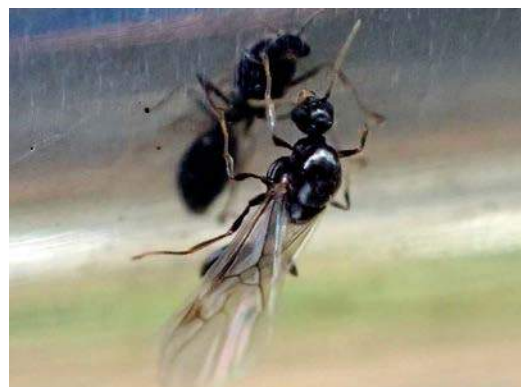
羽アリの同定はむずかしいそうです。 151011