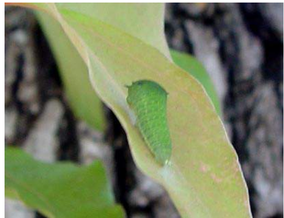
アオスジアゲハの幼虫がクスノキに 150510

アカネ科…ヘクソカズラ 1 アブラナ科…イヌカキネガラシ 2,3 イグサ科…クサイ 2 イネ科…イヌムギ 2、カモジグサ 2、ネズミムギ 2 オオバコ科…ヘラオオバコ 2 カタバミ科…オッタチカタバミ 3 キク科…セイヨウタンポポ 2、ノゲシ 2、ヒメジョオン 1、ヨモギ 1 ケシ科…ナガミヒナゲシ 3 ナデシコ科…イヌコモチナデシコ 2、オランダミミナグサ 1、ツメクサ 2、マンテマ 1 フウロソウ科…アメリカフウロ 1 ヤマゴボウ科…ヨウシュウヤマゴボウ 1 動物…カワラヒワ 0 声、アオスジアゲハ 2,4