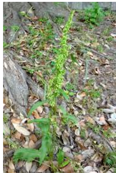
ナガバギシギシ 150510