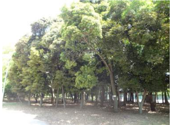
鎮守の森の名残を感じる樹林です 150510