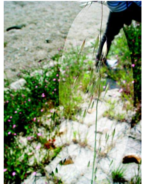
カラスムギがたくさん見られました 150510