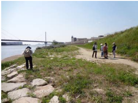
右手のスロープで河川敷から上がりました 150510

動物…アオサギ 4、カワウ 4、スズメ 4、ドバト 4、ハクセキレイ 4、キタキチョウ 4、ギンヤンマ 4、クロモンキノメイガ 4、ツバメシジミ 4、ナナホシテントウ 4、ヒゲナガハナバチの一種 4、ヒメヒラタアブの一種 4、フタモンアシナガバチ 4、モンキチョウ 4、モンシロチョウ 4