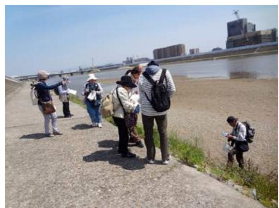
大和川右岸 150510