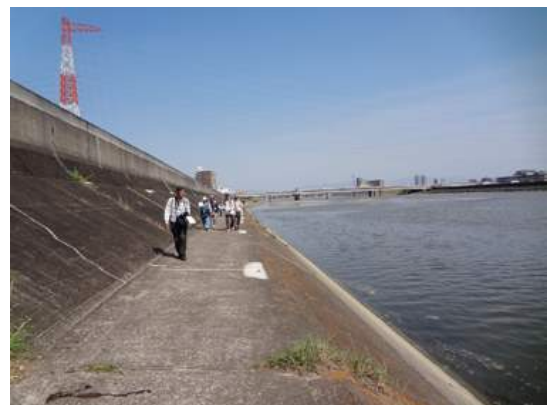
河川敷調査風景 150510