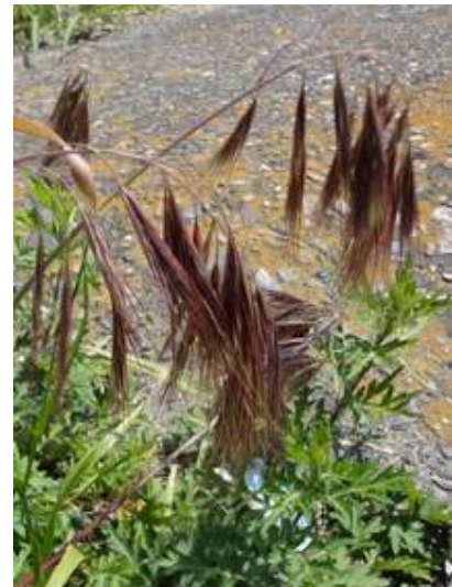
ヒゲナガスズメノチャヒキ。 後にオレンジ色に見えるのがツブダイダイゴケ 150510