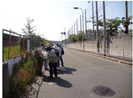
新北島中学校北 150510

イネ科…スズメノカタビラ 2、ネズミムギ 2、 ヒゲナガスズメノチャヒキ 2 オオバコ科…ヘラオオバコ 2 カタバミ科…オッタチカタバミ 1 キキョウ科…ダンダンギキョウ 1、ヒナキキョウソウ 2 キク科…オオアレチノギク 1、セイヨウタンポポ 3 ケシ科…ナガミヒナゲシ 3 ゴマノハグサ科…タチイヌノフグリ 2 ナデシコ科…ノミノツヅリ 2 マメ科…カラスノエンドウ 3 動物…キジラミの一種 4、ナミテントウ 2、ヒメバチの一種 4、フタモンアシナガバチ 4、モンシロチョウ 4