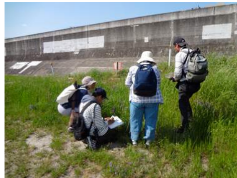
草地には多種の野草がみられました。 150510