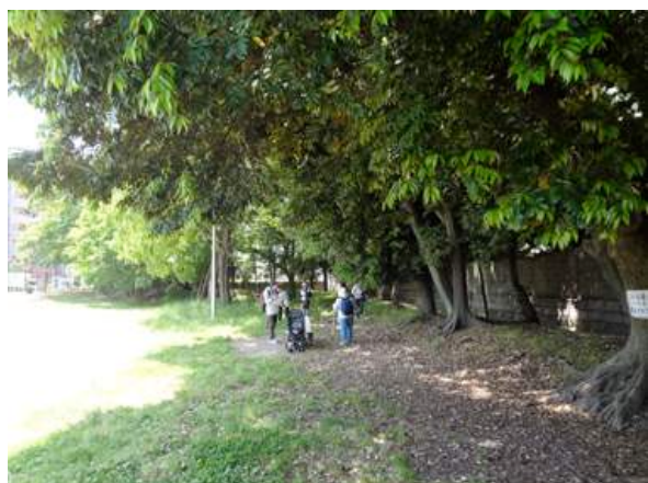
調査風景 150510