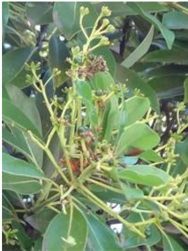
タブノキ 150510