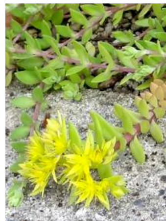
ツルマンネングサ 150510