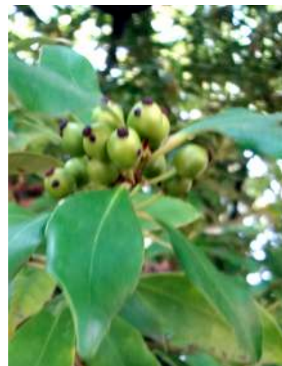
モチノキ 150510