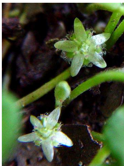
アオイゴケ sp の花 150510