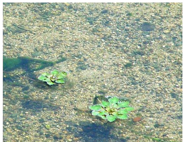
ヒシが浮かんでいました 150510