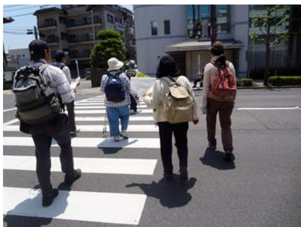
住之江通:住之江公園前には信号が無く、一筋東の信号 を渡りました。150510

カタバミ科…アカカタバミ 2、ムラサキカタバミ 2 キク科…チチコグサモドキ 2 ケシ科…ナガミヒナゲシ 2 ゴマノハグサ科…タチイヌノフグリ 2 スミレ科…スミレ 1 ナデシコ科…コハコベ 2 マメ科…コメツブツメクサ 2 動物…ツバメ 4