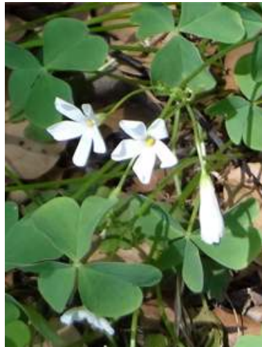
イモカタバミ: 葯が黄色 150510