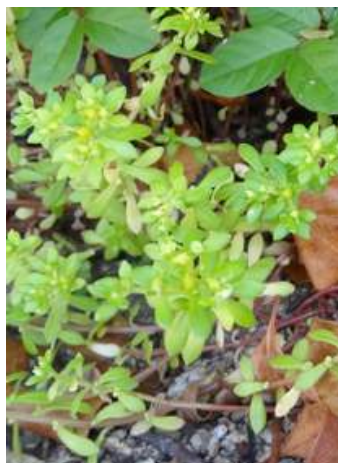
コモチマンネングサ 150510