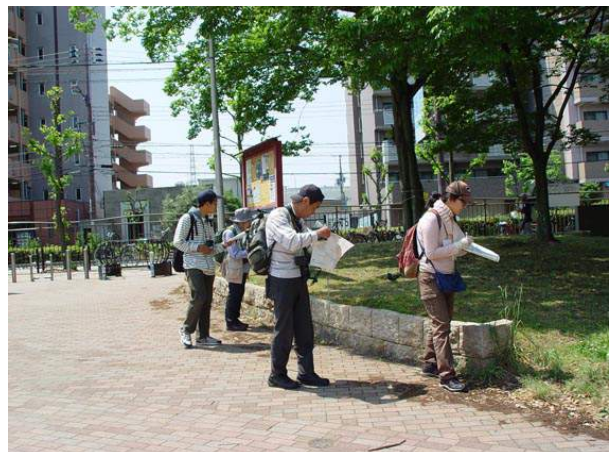
住之江公園で調査開始 150510