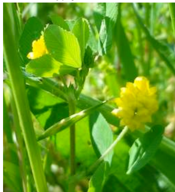
クスダマツメクサ 150510