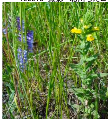
左: ナヨクサフジ 右: セイヨウヒキヨモギ 150510