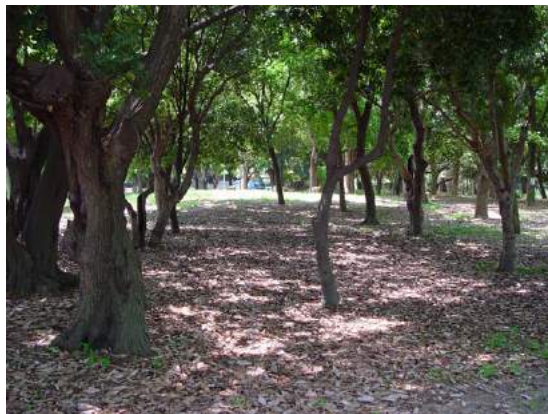
落ち葉が残り、木漏れ日も美しい。 管理コスト削減の結果であったとしても 森の中を散策する気分を味わえる場所です。 150510

アカネ科…ヤエムグラ 1 イネ科…イヌムギ 2、カモジグサ 2、スズメノカタビラ 2、 ネズミムギ 2 オオバコ科…オオバコ 1 カタバミ科…カタバミ 1 キク科…ウラジロチチコグサ 1、セイヨウタンポポ 2,3、 メリケントキンソウ 2 ケシ科…ナガミヒナゲシ 2 ゴマノハグサ科…フラサバソウ 3 タデ科…アレチギシギシ 2 ナデシコ科…オランダミミナグサ 1,2、ツメクサ 2 バラ科…シャリンバイ 2(植) フウロソウ科…アメリカフウロ 2 マメ科…シロツメクサ 2 マンサク科…アメリカフウロ 3(植)、フウ 3(植) 動物…スズメ 4、ドバト 4、ハシブトガラス 4、アゲハチョウ 4、ヤノイスアブラムシ 4