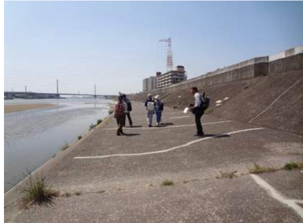
このエリアは土の無い護岸の道が続いています。