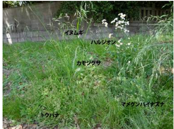
住之江公園内西側 150510