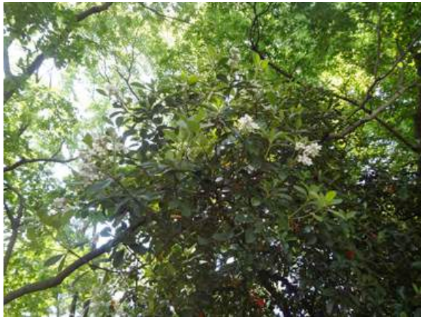
シャリンバイ 150510

動物…スズメ 4、ハシブトガラス 4、アオスジアゲハ 4、オオヨコバイ 4、オオワラジカイガラムシ 4、 ギシギシアブラムシ 4、キムネクマバチ 4、クモガタテントウ 4、セグロカブラハバチ 4、トベラキジラミ 4、 ナミテントウ 4、ハリブトシリアゲアリ 4、ムーアシロホシテントウ 4