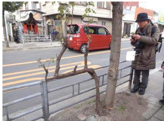
シラカシ、バラの植栽:バラは太さもさながらですが横に伸ばせているのは管理者の遊び心でしょうか?最初に植えたと思われる民家は空き地になっていました。160117

動物…キジバト 4、スズメ 4、ヒヨドリ 0 声、 ヒロヘリアオイラガ 0 羽化後繭