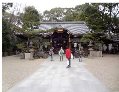
杭全神社 160117

カタバミ科…カタバミ 1、ムラサキカタバミ 1 キク科…ノゲシ 1 クスノキ科…クスノキ 3(植?、巨木) ツバキ科…サザンカ 2(植)、ツバキ 2(植) ヒガンバナ科…ヒガンバナ 1 メギ科…ナンテン 3(植) モチノキ科…クロガネモチ 3(植) ロウバイ科…ロウバイ 2(植) 動物…ドバト 4、ハシボソガラス 4、ヒヨドリ 4