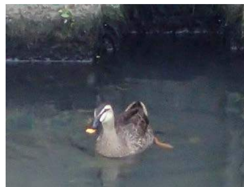
カルガモ(平野川) 160117