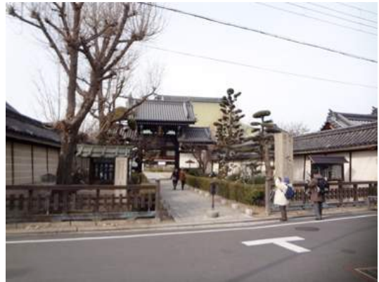
大念佛寺前 160117