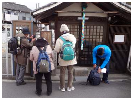
馬場口地蔵堂(平野環濠都市遺跡):地蔵堂は馬場口門の傍らにあったもので、大門の木戸口は泥堂口とともに奈良街道の大阪、天王寺方面に接続していて、大阪方面から大念佛寺への参詣口でもあった。(看板説明)