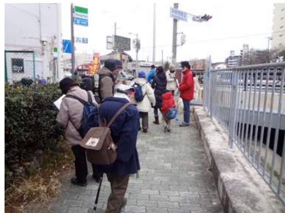
百済橋手前 160117

イネ科…オヒシバ 3(立枯れ) キク科…ノゲシ 2 クマツヅラ科…ランタナ 2,3(植) シソ科…ホトケノザ 1 トウダイグサ科…ナガエコミカンソウ 3 動物…オナガガモ 4、カワセミ 4