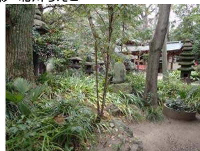
境内には実生の樹木がいっぱい 160117

アカネ科…クチナシ 3(植) イチヨウ科…イチヨウ 0 落葉(植、巨木) カタバミ科…ムラサキカタバミ 1 カヤツリグサ科…ナキリスゲ 3 キク科…オニタビラコ 1 クスノキ科…クスノキ 3(植) ジンチョウゲ科…ジンチョウゲ 1(植) センリョウ科…センリョウ 3(植) ツバキ科…サザンカ 2(植)、ツバキ 2(植) ミズキ科…アオキ 3(植) ミソハギ科…サルスベリ 0 落葉(植) メギ科…ナンテン 3(植) ヤシ科…カンノンチク 1(植) ヤブコウジ科…マンリョウ 3(植、赤、白色果実) ユリ科…ヤブラン 3(植) 動物…シロハラ 4、ドバト 4、ハシボソガラス 4、ヒヨドリ 4、アオスジアゲハ 2(死体)、クマゼミ 0 羽化殻、 ヒロヘリアオイラガ 0 羽化後繭、マエアカスカシノメイガ 4