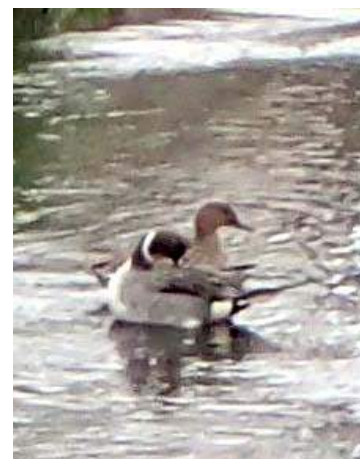
オナガガモ(平野川) 160117