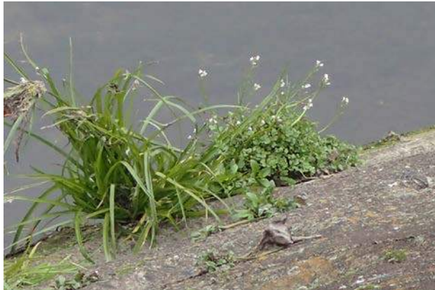
不明イネ科(左)とタネツケバナ?(右) 川に近寄れませんので、植物の種名が はっきりしません。160117 撮影 榎元慶子

カタバミ科…オオキバナカタバミ 2、オッタチカタバミ 2、ムラサキカタバミ 1 カヤツリグサ科…メリケンガヤツリ 3 キク科…アメリカセンダングサ 1、ノゲシ 2、ノボロギク 2、ヨモギ 1 タデ科…イヌタデ 3、ヒメツルソバ 2 ゴマノハグサ科…フラサバソウ 1 バラ科…シャリンバイ 1(植) フサンダ科…カニクサ 1 マメ科…カラスノエンドウ 1 動物…オナガガモ 4、カルガモ 4、カワウ 4、コガモ 4、ハクセキレイ 4、マガモ 4、モンシロチョウ 2 蛹、 ユスリカの一種 4、クロガケジグモ 0 巣