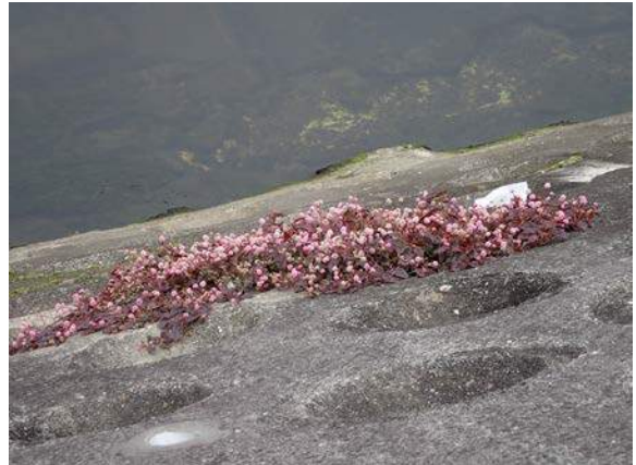
ヒメツルソバ 160117