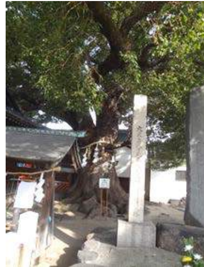
クスノキ:保存樹 13 号、 昭和 43 年 10 月 1 日、樹高 18.9m、 樹周 6.8m 160117

メッシュ No.513574444(795) 国道 25 号線南側(平野小学校前)～平野小学校東 アブラナ科…アブラナ sp2(植) キク科…コスモス 2(植) ゴマノハグサ科…オオイヌノフグリ 1 シソ科…ホトケノザ 1 ベンケイソウ科…カネノナルキ(カゲツ)2(植) 動物…クロツヤミノガ 0 糞