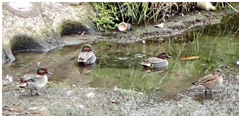
コガモ(平野川) 160117