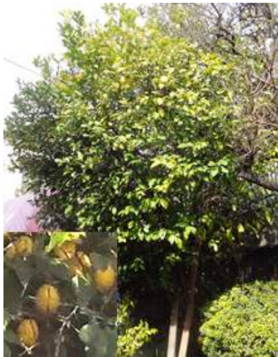
民家の前でレモンがたわわに実っていました。160117