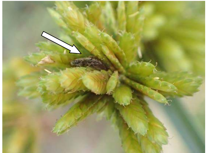
カメムシ亜種の一つ(メリケンガヤツリに) 160117