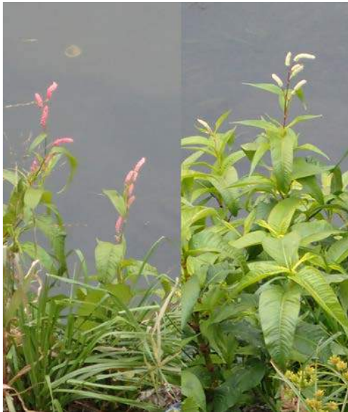
オオイヌタデ? (赤、白花) 160117

ヒガンバナ科…スイセン 2(植) ベンケイソウ科…カラコエ 2(植) マメ科…カラスノエンドウ 1 メギ科…ナンテン3(植) モクセイ科…レンギョウ 2(植) 動物…ウグイス 0 声、コサギ 4、ハシボソガラス 4、 ヒドリガモ 4、ホシハジロ 4、カメムシ亜種の一つ 4、 キジラミの一つ 4