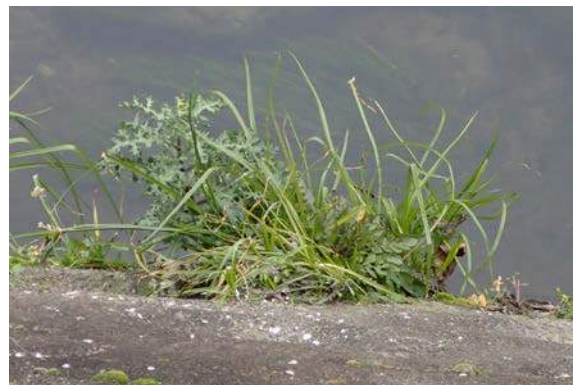
左からノボロギク、メリケンガヤツリ、他不明種 160117

アオイ科…タチアオイ 3(植) アカネ科…ヘクソカズラ 1、ヤエムグラ 1 アブラナ科…セイヨウカラシナ 1 イネ科…アキノエノコログサ 3、イヌムギ 2、イネ科 sp1、 エノコログサ 3(立枯れ)、オヒシバ 3(立枯れ)、 ジュズダマ 3、チガヤ 1、メヒシバ 3 イラクサ科…カラムシ 1 オシロイバナ科…オシロイバナ 1 カタバミ科…オオキバナカタバミ 2、カタバミ 2、ムラサキカタバミ 1 カヤツリグサ科…メリケンガヤツリ 3 キク科…セイタカアワダチソウ 1、ノゲシ 1、ヒメムカシヨモギ 3(立枯れ)、ヨモギ 1 クスノキ科…クスノキ 3(植) クマツヅラ科…ランタナ 2,3(植) ゴマノハグサ科…フラサバソウ 1 シソ科…チェリーセージ 2(植)、ホトケノザ 2 スイカズラ科…ハナツクバネウツギ 2(植) タデ科…アレチギシギシ 1、オオイヌタデ? 2(赤、白花) ツユクサ科…ツユクサ 1、ムラサキツユクサ 2(植) トウダイグサ科…コニシキソウ 3 ナス科…ワルナスビ? 3 バラ科…シャリンバイ 3(植)