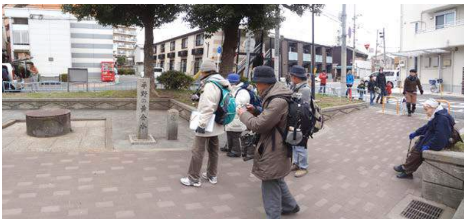
平野公園での調査風景 160117

セリ科…ヤブジラミ 1 タデ科…ミチヤナギ 1 ツバキ科…カンツバキ 2(植) ナス科…イヌホオズキ 2,3 ナデシコ科…オランダミミナグサ 1、ミドリハコベ 1 マメ科…カラスノエンドウ 1、コメツブツメクサ 1、シロツメクサ 1,2 メギ科…ナンテン3(植) 動物…ドバト 4、ヒヨドリ 4、ムクドリ 4