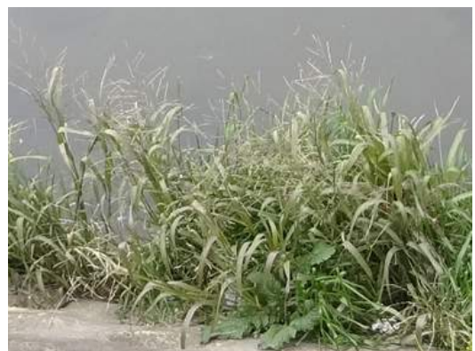
平野川に点在していた不明イネ科 160117