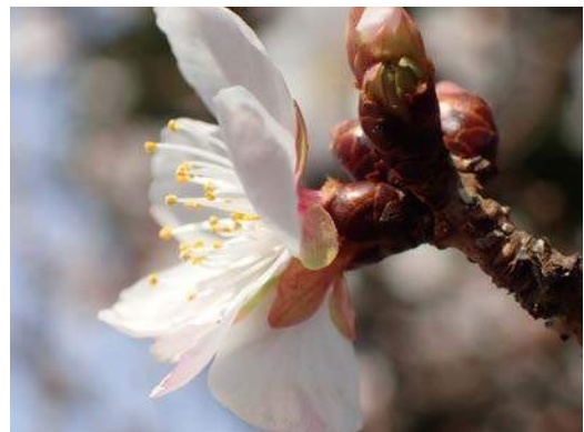
サクラ sp が、咲いていました。 160117 撮影 榎元慶子

カタバミ科…カタバミ 1、ムラサキカタバミ 1 キク科…アレチノギク 2、ウラジロチチコグサ 1、 チチコグサモドキ 2、ノゲシ 1 クスノキ科…クスノキ 3(保存樹 13 号、 昭和 43 年 10 月 1 日、樹高 18.9m、樹周 6.8m) シソ科…ホトケノザ 2 ツバキ科…サザンカ 2(植) ナス科…イヌホオズキ 1 バラ科…ジュウガツザクラ? 2(植)、フユザクラ? 2(植)、 ユキヤナギ 2(植) フウロソウ科…アメリカフウロ 1 動物…ウグイス 0 声、シロハラ 0 声、ツグミ 4、ドバト 4、ハシブトガラス 4、ヒヨドリ 4、ムクドリ 4、 アオフトメイガ 0 幼虫の巣跡、オオニジゴミムシダマシ 4