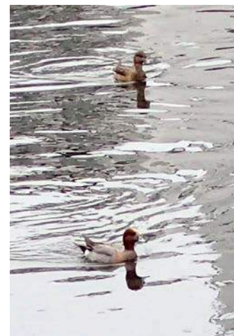
ヒドリガモ(平野川) 160117