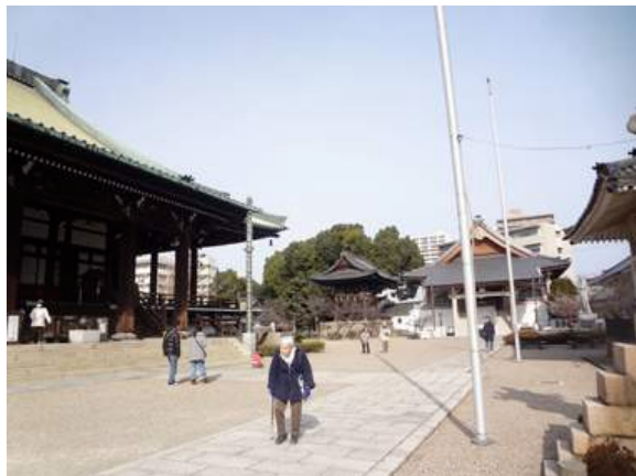
大念佛寺境内：奥に巨木の保存樹クスノキが見える。160117 撮影 北川ちえこ