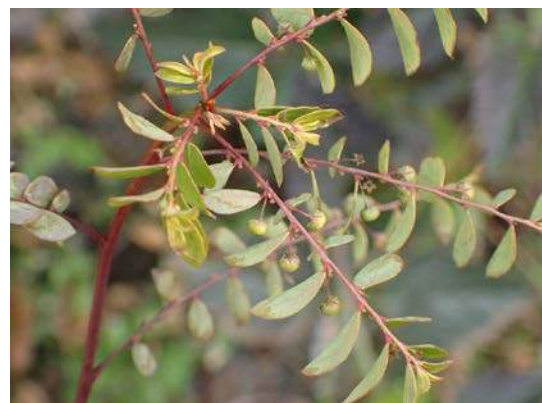
ナガエコミカンソウ 160117

アカネ科…ヤエムグラ 1 アブラナ科…タネツケバナ 1 イネ科…エノコログサ 3、オヒシバ 3(立枯れ)、 コメヒシバ 3(立枯れ) カタバミ科…オオキバナカタバミ 2 キク科…ウラジロチチコグサ 1、オオアレチノギク 1、 オニタビラコ 2、ノゲシ 1、メリケンキンソウ 1、ヨモギ 1 ゴマノハグサ科…オオイヌノフグリ 1、フラサバソウ 1 シソ科…ホトケノザ 1