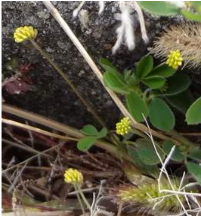
コメツブツメクサ 160117