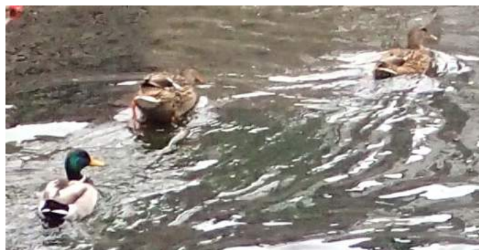
マガモ(平野川) 160117