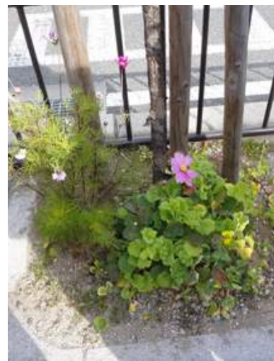
国道沿いにコスモスとナノハナが同時に咲いていました。160117

杭全公園～杭全神社 イグサ科…クサイ 1(立枯れ) カタバミ科…ムラサキカタバミ 1 キク科…ウラジロチチゴサ 1、 チチゴサモドキ 2、ノゲシ 1,2、ヨモギ 1 クスノキ科…クスノキ 3(植)、 クスノキ 1(御神木、大阪指定天然記念物、樹齢千年、 樹高 30m、樹周 10m) シソ科…ホトケノザ 1 ツバキ科…サザンカ 2(植)、ツバキ 2(植) ナデシコ科…オランダミミナグサ 1 動物…スズメ 4、ハクセキレイ 4、