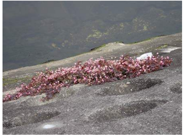
ヒメツルソバ 160117