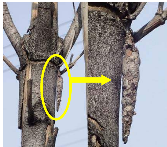
クロツヤミノガ:うろこを貼り付けたような糞 160117

杭全公園～杭全神社 イグサ科…クサイ 1(立枯れ) カタバミ科…ムラサキカタバミ 1 キク科…ウラジロチチゴサ 1、 チチゴサモドキ 2、ノゲシ 1,2、ヨモギ 1 クスノキ科…クスノキ 3(植)、 クスノキ 1(御神木、大阪指定天然記念物、樹齢千年、 樹高 30m、樹周 10m) シソ科…ホトケノザ 1 ツバキ科…サザンカ 2(植)、ツバキ 2(植) ナデシコ科…オランダミミナグサ 1 動物…スズメ 4、ハクセキレイ 4、