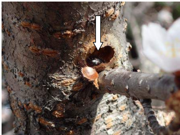
オオニジゴミムシダマシが、サクラの幹の、空き家になつたヒロヘリアオイラガの繭の中に潜んでいた。 160117